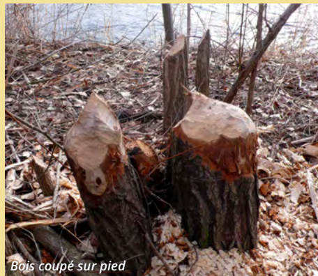
Bois coupé sur pied

Ce qu'on appelle « bois coupé sur pied » est la base d'un tronc ou d'une branche dont le reste a été coupé et emporté par le castor.