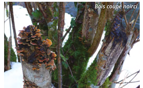
Bois coupé noirci

Il est très difficile de dater précisément une coupe de bois. Néanmoins on peut faire la différence entre un bois coupé récemment, encore assez blanc, avec des copeaux et d'aspect « frais », et un vieux reste noirci. C'est important car du bois coupé par un castor peut rester visible pendant des années, voire des dizaines d'années même si les castors ont déserté les lieux depuis longtemps !