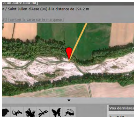
Carte de localisation faune-paca.org

Noter le maximum d'informations en remarque