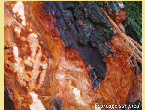
Ecorçage sur pied

Un « écorçage sur pied » est un tronc ou une branche écorcée par le castor. Attention : les ragondins pratiquent parfois aussi l'écorçage, mais seulement ponctuellement et en petite quantité.