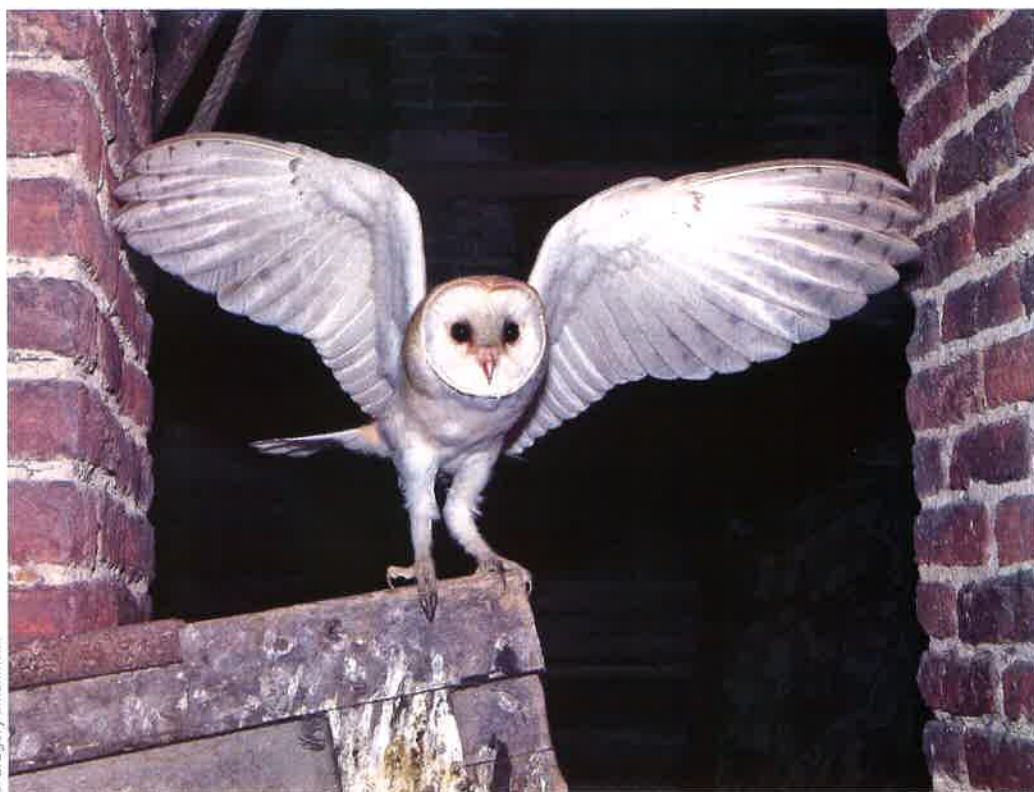
Effraie des clochers.