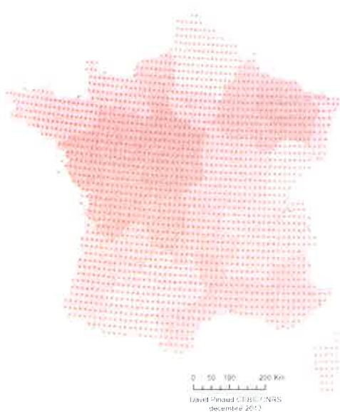
Figure 1. Représentation et localisation des 2007 carrés centraux des mailles IGN retenus dans le cadre de l'enquête nationale rapaces nocturnes.

Afin de visualiser précisément l'emplacement des 25 points d'écoute, de s'assurer de leur accessibilité et de visualiser les différents milieux prospectés, une sortie de jour est vivement recommandée. Elle vous permettra, en outre, de tracer un itinéraire pour parcourir au plus vite les trajets entre les points d'écoute de nuit. Si possible, il est