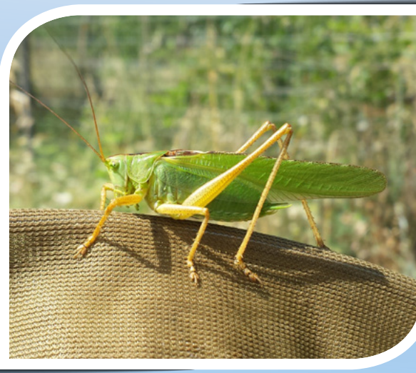
Grande Sauterelle Verte