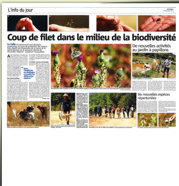
Var-Matin le 8/8/2017