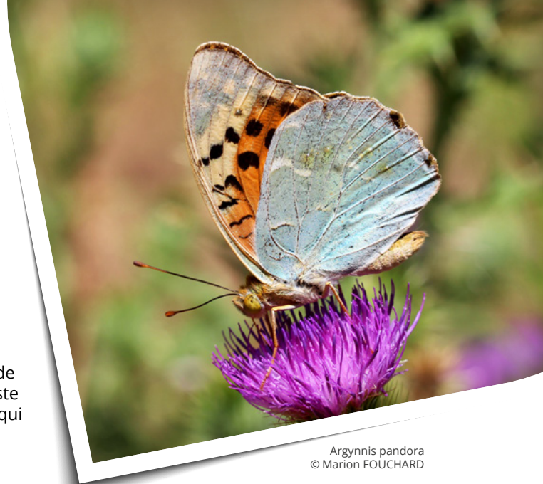
Argynnis pandora