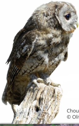
Chouette hulotte © Olivier HAMEAU