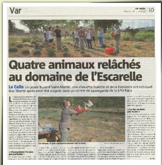
Edition La Marseillaise le 26/11/2016