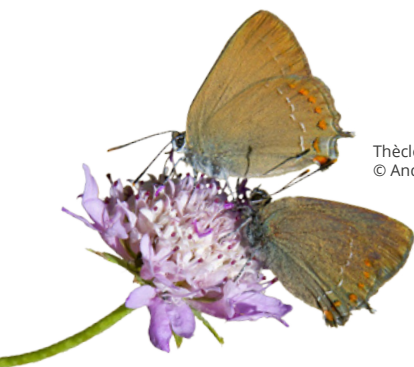
Thècle de l'acacias © André SIMON