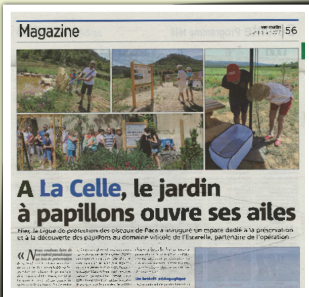
Var-Matin le 5/6/2017