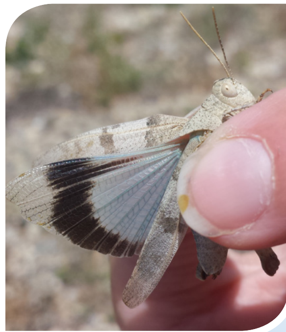
Cedipode turquoise