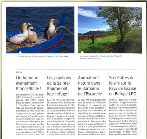
Oiseau Magazine n°126