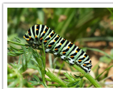
Chenille de Machaon