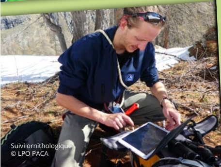
Suivi ornithologique