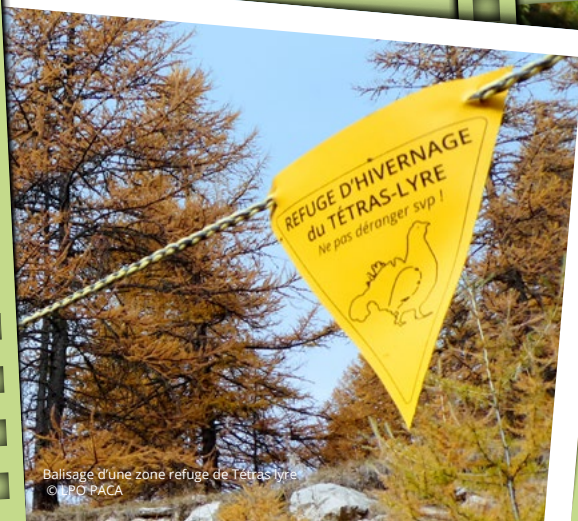
Balisateur d'une zone refuge de Tétrasyre