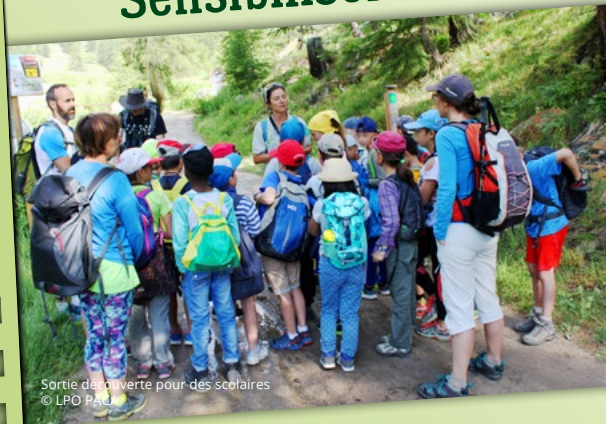
Sortie de découverte pour des scolaires