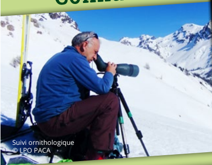
Suivi ornithologique