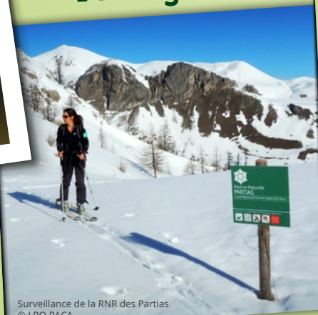
Surveillance de la RNR des Partias