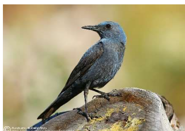
Monticole Bleu