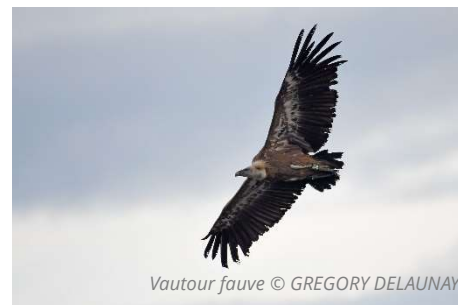
Vautour fauve

Ces journées sont déclinées selon trois entités bio géographiques : Montagne ; vallées de la Bléone et de la Durance / plateau de Valensole et Verdon, afin de permettre la découverte des spécificités paysagères et ornithologiques de votre milieu de vie et de travail en apprenant à reconnaître les oiseaux associés aux milieux naturels (plaines agricoles, forêts, falaises et garrigues).