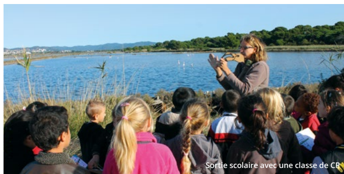
Sortie scolaire avec une classe de CP