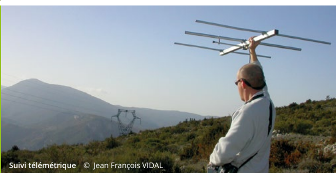
Suivi télémétrique