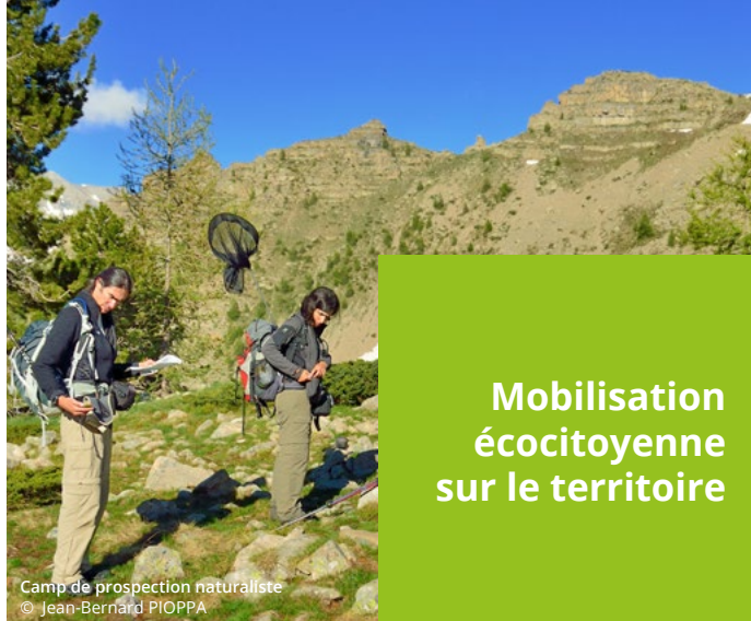
Camp de prospection naturaliste

Mobilisation écocitoyenne sur le territoire