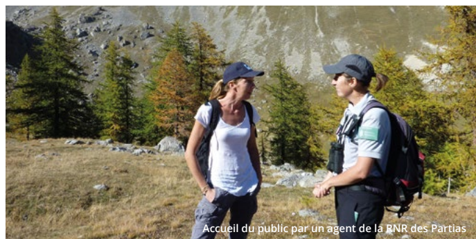
Accueil du public par un agent de la RNR des Partias