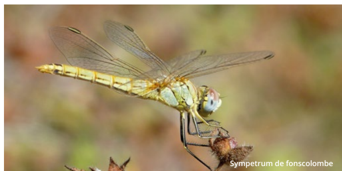
Sympetrum de fonscolombe