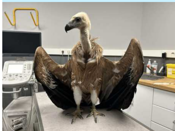
Le vautour fauve de La Roquebrussanne

pensionnaires, notons un gypaète barbu (qui a vite rejoint les Grands Causses), moult hiboux petit-duc et martinets (des noirs surtout, mais aussi quelques pâles et un martinet alpin), des hulottes et des chevêches , un oedicnème criard , une cigogne blanche , un vautour fauve , un aigle royal , plusieurs huppes fasciées et quelques rolliers .