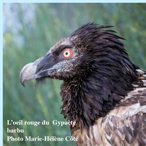
L'oeil rouge du Gypaète barbu

Du côté des mammifères, le Centre a accueilli des dizaines de hérissons et écureuils juvéniles (ce qui veut dire beaucoup de bouches à biberonner) et plusieurs pipistrelles qui sont, elles, nourries au pinceau.