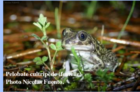
Pelobate cultripède (femelle) Photo Nicolas Fuento.

Le site du Plan, à Oppède, fait partie des zones humides du Calavon inscrites au réseau des Espaces naturels sensibles (ENS) du Département de Vaucluse. Il abrite 7 espèces d'amphibiens, dont le célèbre Crapaud à couteaux (ou Pélobate cultripède) , qui est une espèce menacée, en danger d'extinction à l'échelle régionale.