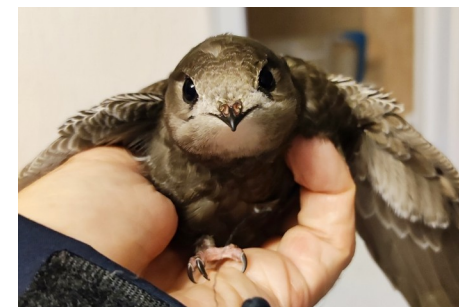
Jeune Martinet pâle tombé du nid = oiseau en danger