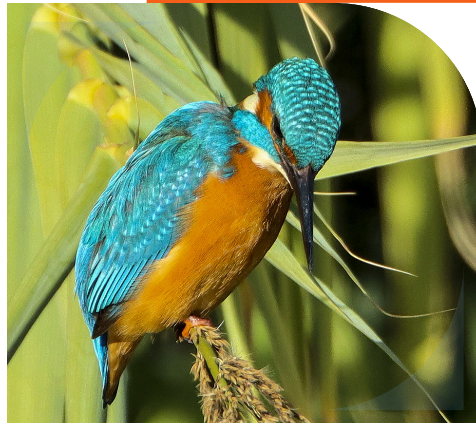
Martin-pêcheur d'Europe

Tous nos rendez-vous sur paca.lpo.fr/agenda