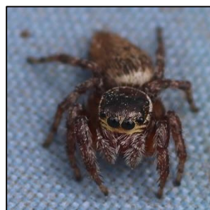
Evarcha Jucunda