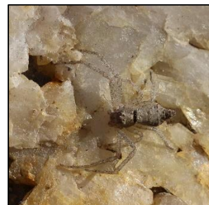
Tmarus staintoni