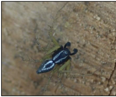
Oxyopes lineatus