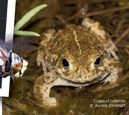
Crapaud calamite