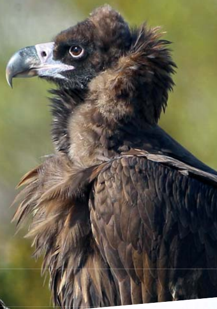
Vautour moine