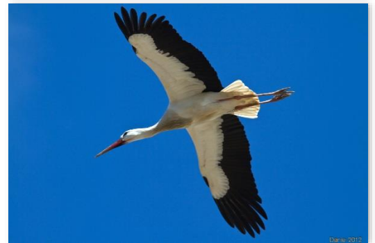
Cigogne blanche

Un passage important d'Hirondelles rustiques a eu lieu ce samedi avec 1923 individus dénombrés. À noter également la présence d'un Tarier des prés en halte migratoire sur le site et le passage de 2 Cigognes blanches.