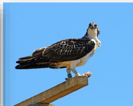
Balbuzard pêcheur

LEBEGUE Eve – eve.lebegue@lpo.fr LPO Provence-Alpes-Côte d'Azur