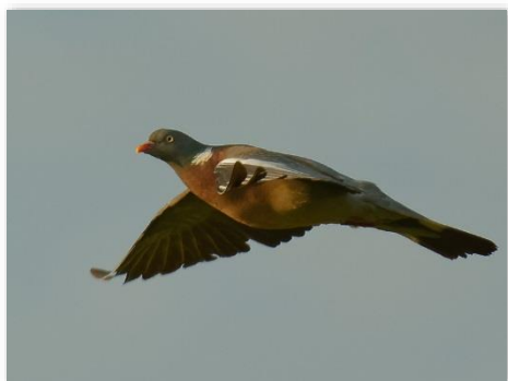
Pigeon ramier

Venez admirer le passage des derniers migrateurs de l'année, au Fort de la Revère le samedi 24 et dimanche 25 octobre 2015 de 8h00 à 18h00.