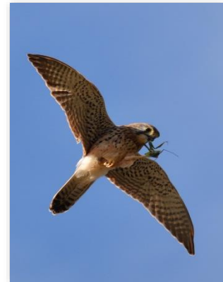
Faucon crécerelle en train de se nourrir sur le site

Avec 10 observateurs bénévoles sur le site sur les 2 jours, plus de 160 visiteurs ont profité de la présence de la LPO PACA pour admirer 67 individus de rapaces migrateurs dont 24 Circaètes Jean-le-Blanc, 13 Faucons crécerelles, 5 Busards des roseaux, 1 Milan royal, ainsi que 157 hirondelles (toutes espèces confondues) et 381 Martinets pâles. A noter la présence de 3 Cigognes noires en migration sur le site.