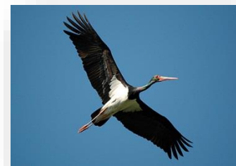
Cigogne noire