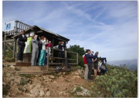
Observateurs au Camp de migration

Les entrées maritimes présentes dimanche 25 octobre ont perturbé le suivi scientifique à partir de 10h35. Notons tout de même qu'avant leur apparition, 670 Pigeons ramiers ont pu être observés en 6 vols (maximum 180 individus par vol) et 296 Pinsons des arbres.