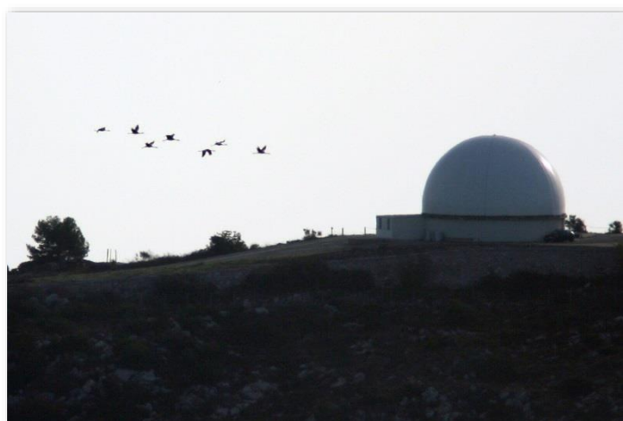
Grues cendrées au-dessus de l'observatoire de la tête de Chien

Fort reconnaissable par leur vol en V et leur cri lors de leur passage au-dessus de nos têtes, les Grues cendrées offrent un spectacle unique en ce début du mois de novembre.