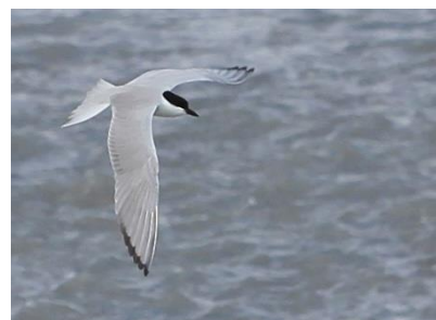
Sterne hansel © Jocelyne Ben-Saïd

La perte de qualité des habitats de reproduction et les dérangements pourraient expliquer la quasi-disparition de l'espèce en Provence au profit de sites plus propices. À l'embouchure du Var, la Sterne hansel est une migratrice rare mais régulière au printemps. L'espèce est souvent observée au mois de mai comme le démontre ces trois individus relevés ce 20 mai.