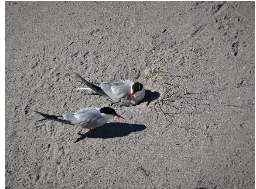
Couples de Sternes pierregarins

Les Sternes pierregarins sont toujours aussi nombreuses et la reproduction semble bien se dérouler. Les oiseaux ayant perdu leur nid la semaine passée à cause des fortes pluies, tentent une deuxième couvée. Jusqu'à 178 nids ont été dénombrés cette semaine et 14 premiers poussins sont nés (voir tableau 1). 1 Sterne hansel volait au-dessus de la colonie de Sternes pierregarins, se faisant parfois poursuivre. 2 autres individus ont été observés un peu plus en aval du fleuve. Il est à noter que d'autres Sternes pierregarins, une quinzaine environ, se sont installées sur un îlot en amont du pont Napoléon III. Aucun point d'observation correct ne permet de compter précisément les couples nicheurs.