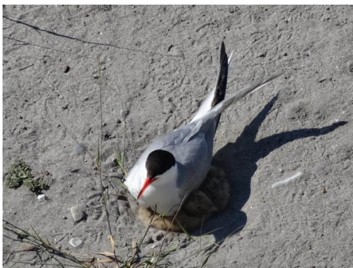
Sterne pierregarins protégeant ses petits

Le nombre de Sternes pierregarins est stable. Malgré de fortes pluies dimanche 29 mai, le niveau du Var ne semble pas avoir trop monté et les nids les plus proches des berges des îlots n'ont pas été inondés. Au total 137 nids ont été relevés (4 sur l'îlot en amont du pont, 114 sur l'îlot rive gauche en aval du pont et au moins 23 sur l'îlot plus en aval). 45 poussins ont été observés dont 13 âgés d'une semaine, 26 âgés de deux semaines et 6 âgés de 3 semaines (cf. tableau 1).