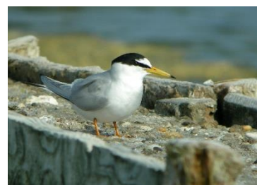
Sterne naine

Dans la ZPS, la Sterne naine ne se reproduit plus depuis la fin des années 1990. Elle n'est observée que rarement et seulement en halte migratoire, comme le démontre ces 4 individus relevés le 2 juin 2016.