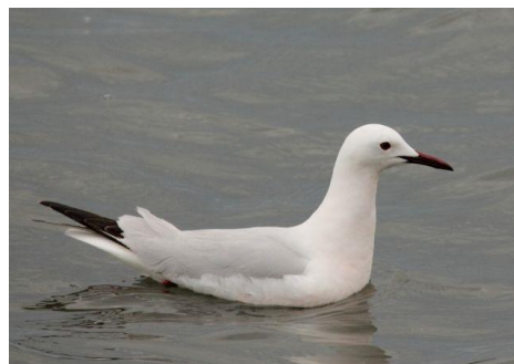
Goéland railleur

À l'embouchure du Var, cette espèce se rencontre en petits effectifs principalement au printemps. Cet oiseau observé le 4 juin concerne un adulte n'ayant probablement pas réussi sa nidification et maintenant devenu erratique sur les côtes méditerranéennes.