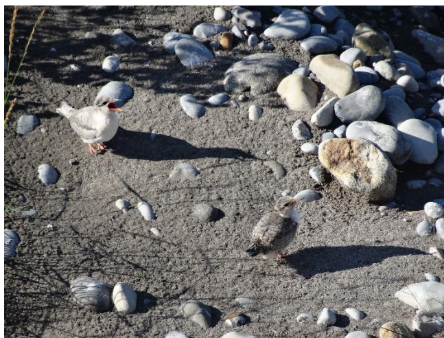
Deux jeunes Sternes pierregarins de 4 semaines

Le nombre de Sternes pierregarins est stable. De fortes pluies survenues jeudi 9 ne semblent pas avoir noyé beaucoup de nids mais certains sont maintenant très proches du bord de l'eau. 140 nids sont présents sur cet îlot du pont Napoléon III (cf. tableau 1). Les sternes ayant perdues leur nichée font une nouvelle tentative sur le même îlot ou se sont reportées sur l'îlot plus en aval (au moins 40 nids contre 23 le 3 juin). Quelques poussins sont morts mais d'autres sont nés, ce qui donne une stabilité des chiffres entre la semaine dernière et cette semaine (46 poussins au total avec 16 poussins d'une semaine, 15 poussins de deux semaines, 9 poussins de trois semaines et 6 poussins de quatre semaines). Les poussins de 4 semaines seront volants ou quasi volants dès la semaine prochaine.