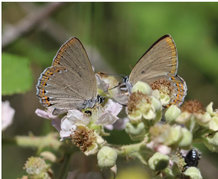
Les ronciers, une source de nectars infini pour les Thècles du frêne

À la fin de chaque séance de captures et d'identification sur une zone, Marion fait le point avec tout le monde sur les différentes espèces observées et les critères permettant de les identifier.