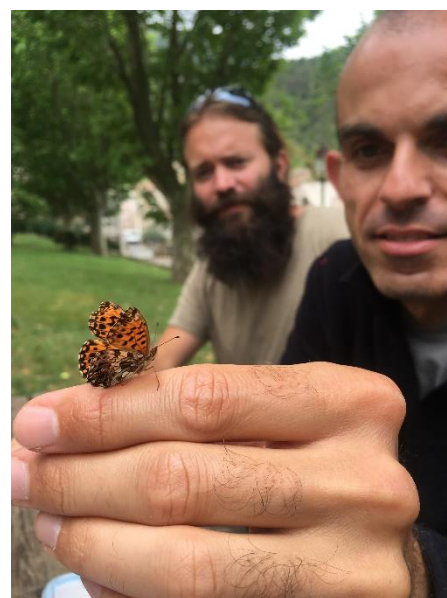
Petite Violette prenant part à la pause déjeuner

La première journée s'est déroulée en salle avec un exercice sur l'anatomie, la morphologie et les différentes parties du papillon afin de connaître le vocabulaire nécessaire à l'identification. Des exercices ont suivi pour comprendre le cycle de vie des lépidoptères, expliquer les grands traits biologiques et identifier quelle espèce peut-on observer en fonction de la saison et de l'endroit.