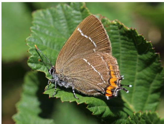
Thècle de l'orme

Marion et Evelyne s'entraînent à identifier des papillons capturés à l'aide de la clé de détermination avant de les relâcher.