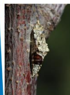
Nymphes d'une Piéride du Chou