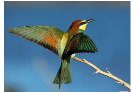
Guêpier d'Europe