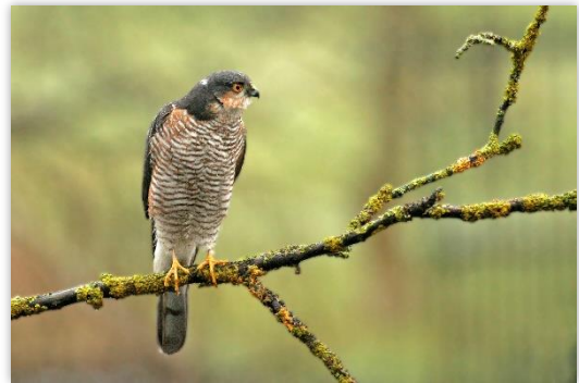
Epervier d'Europe

Ces faibles scores par rapport à l'année précédente (par exemple, 121 Hirondelles rustiques, 1211 Guêpiers d'Europe et 23 Bondrées apivores en 2015 sur la même période) s'expliquent notamment par des entrées maritimes le dimanche 4 septembre empêchant les observations.