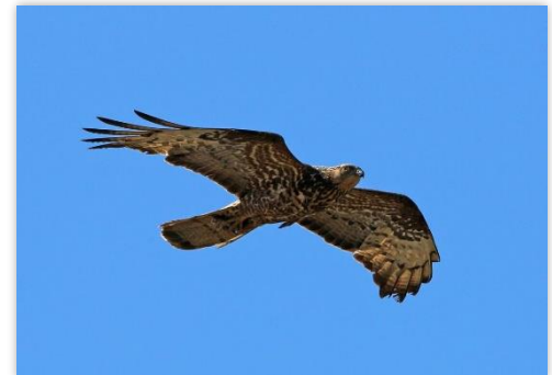
Bondrée apivore © Aurélien Audevard

Oiseaux patrimoniaux et emblématiques de notre région, les rapaces migrateurs s'invitent au Camp de migration le mercredi 14 septembre et le samedi 17 et dimanche 18 septembre 2016 où accueil, animation et observation des oiseaux avec le prêt de matériel optique seront mis en place sur le site de 8h00 à 17h00.