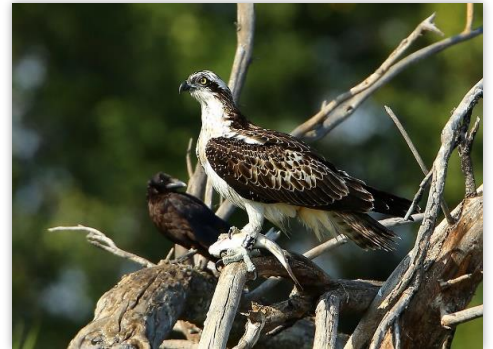
Balbuzard pêcheur

A noter, les premiers passages des Busards des roseaux (9 individus) et des Faucons hobereaux (8 individus).