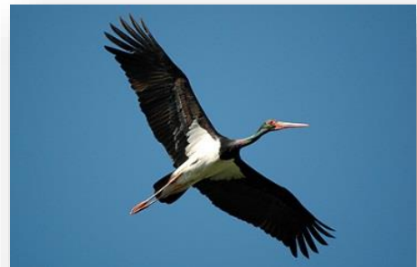
Cigogne noire