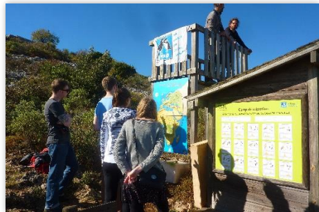
Visiteurs et observateurs au camp de migration

Les samedi 15 et dimanche 16 octobre, les spotteurs ont dénombré 5 306 individus pour 13 espèces. Ces dates sont marquées par les premiers passages des passereaux et des Pigeons ramiers. Concernant les passereaux, 1 783 individus ont été relevés dont 10 Pipits farlouses, 16 Accenteurs mouchets, 1 Pinsons du Nord, 1713 Pinson des arbres.