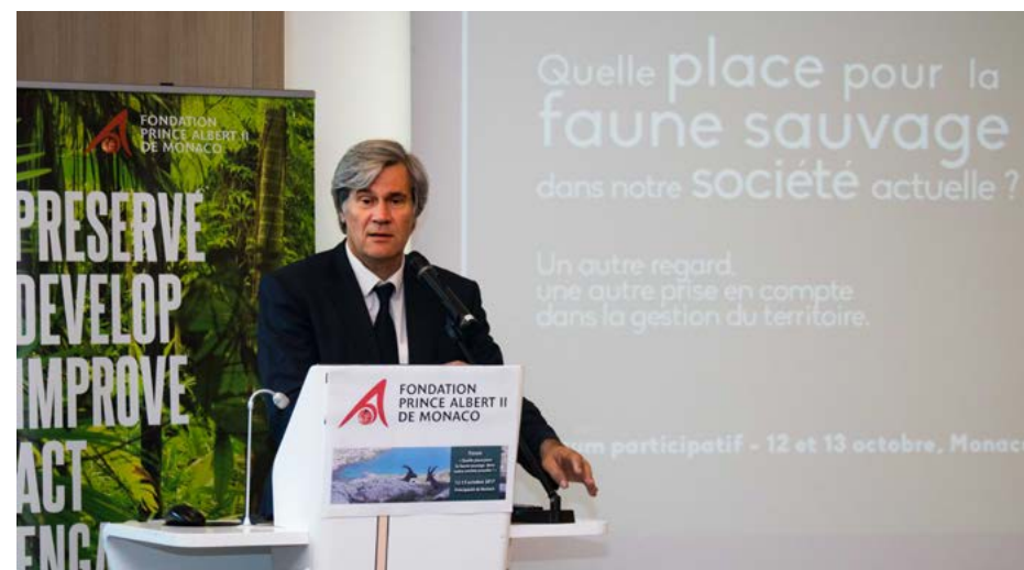
M. Stéphane Le Foll, ancien Ministre de l'agriculture, de l'agroalimentaire et de la forêt du gouvernement français

Le Forum participatif a été officiellement clôturé par S.A.S. le Prince Albert II de Monaco.