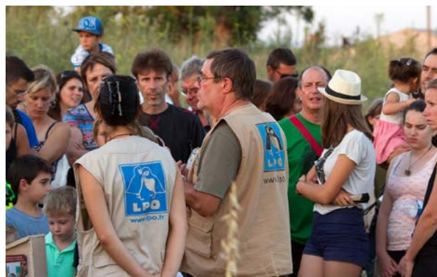
Sensibilisation du public © Michel Roussel