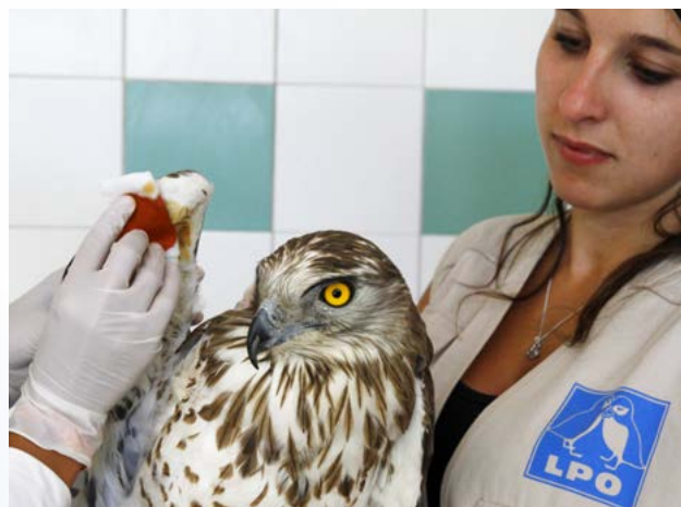
Circète Jean-le-Blanc en soin