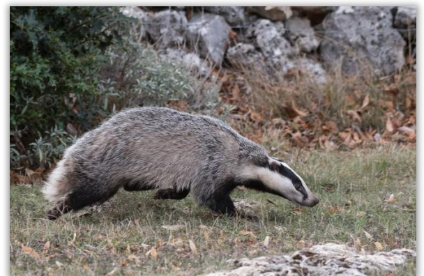
Blaireau d'Europe

12 espèces ont été contactées, principalement grâce à des traces de passage et d'activité pour un total de 72 données dont le Blaireau européen, le Lièvre d'Europe, la Fouine, le Chevreuil européen, l'Écureuil roux.