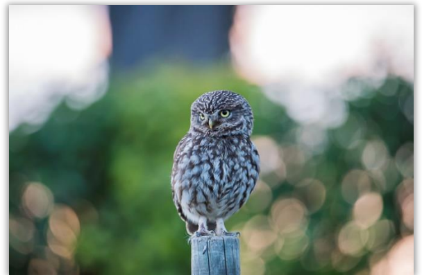
Chevêche d'Athéna

135 espèces d'oiseaux ont été observées, par contact auditif ou visuel. Un total de 2910 données a été produit. 105 espèces présentent un statut de nicheur avéré sur le territoire de la métropole. Parmi eux : la Chevêche d'Athéna, l'Alouette lulu, l'Engoulevent d'Europe, la Fauvette passerinette, le Bruant zizi. Plusieurs espèces de passage ont également été contactées comme le Gobemouche gris, l'Aigle botté, le Chevalier sylvain, la Guifette leucoptère, le Tarin des aulnes.