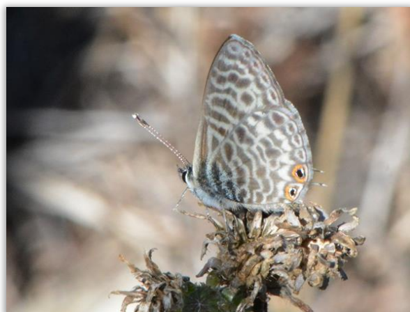
Azuré de Lang

Cigales : 1 espèce identifiée, la Cigale grise.