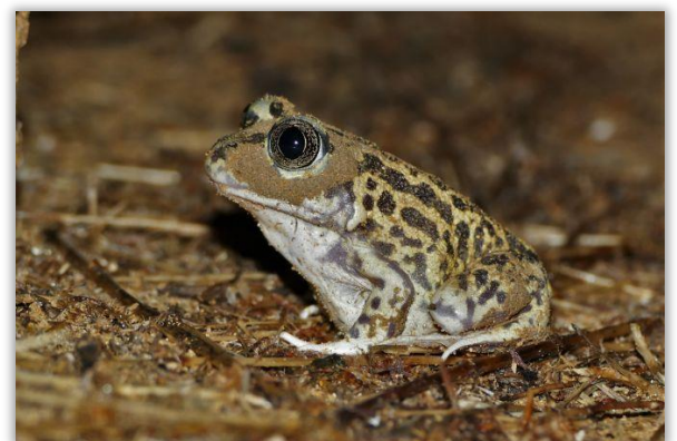
Pélobate cultripède

Hétérocères (papillons de nuit) : 24 espèces contactées pour un total de 52 données dont la Zygène du lotier, la Noctuelle en deuil, le Collier blanc, l'Ecaille fermière, le Sphinx tête-de-mort.