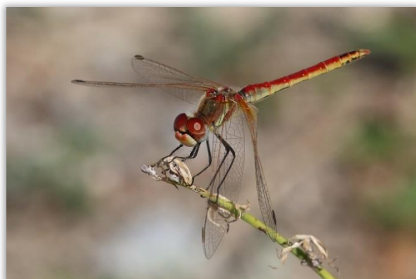
Sympétrum à nervures rouges