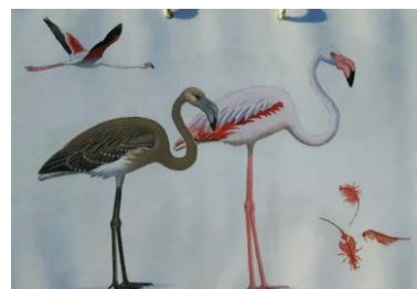
Le flamand rose

– Le gabian (ou le goéland). Il a une pastille rouge sur le bec. C'est le point de quémande. L'oisillon quand il tape dessus fait ouvrir le bec de l'adulte qui le nourrit.