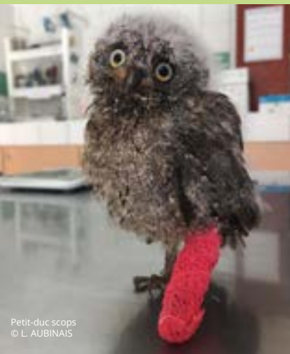
Petit-duc scops