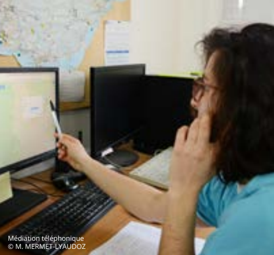
Médiation téléphonique