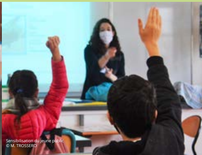
Sensibilisation du jeune public