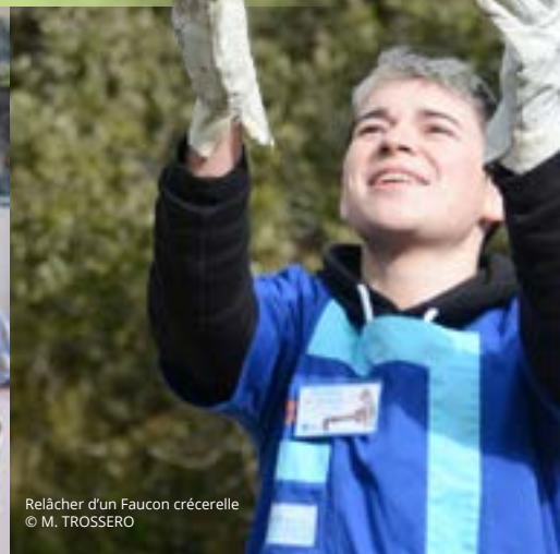
Relâcher d'un Faucon crécerelle