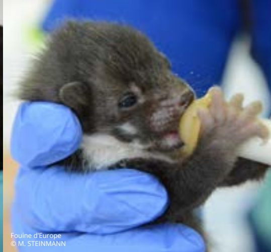
Fouine d'Europe