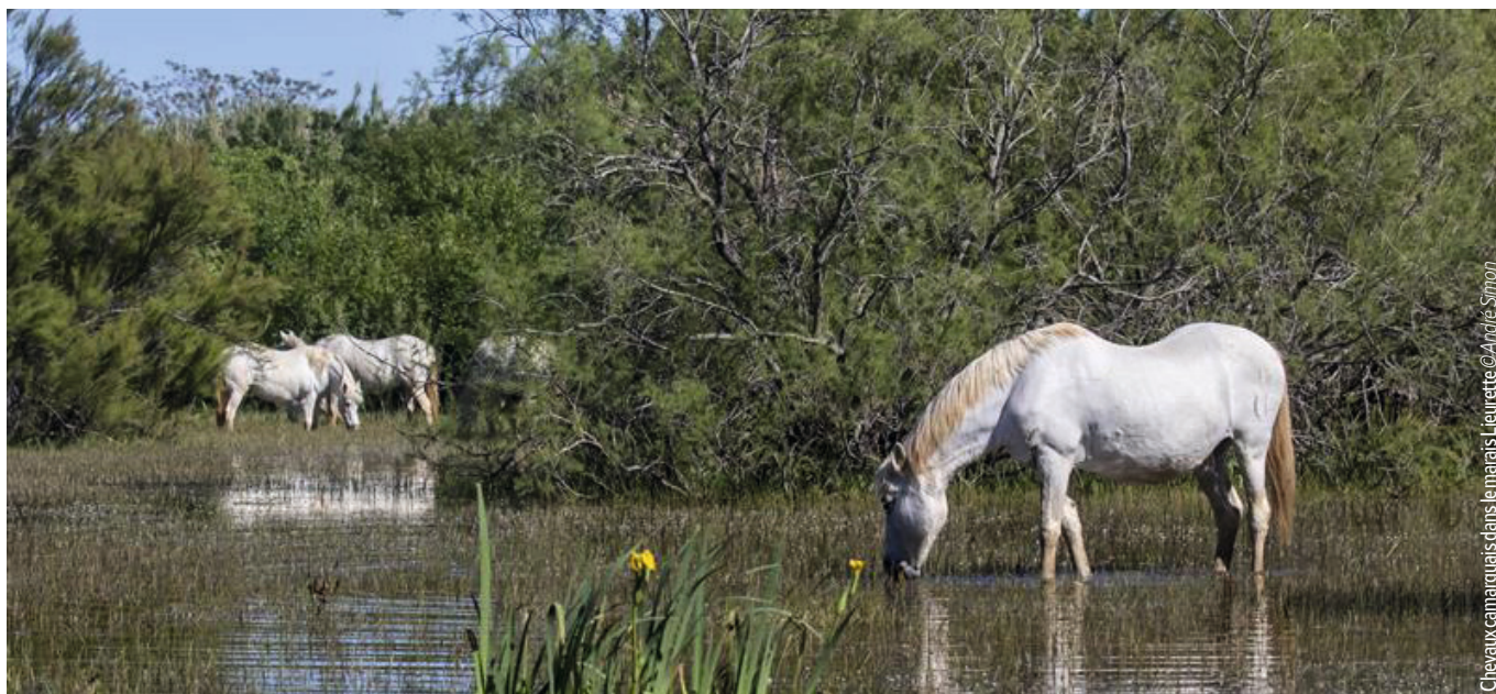
Chevaux camarguais dans les marais du Vigueirat