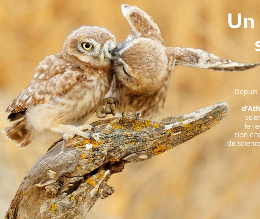
Chevêche d'Athéna

Depuis 2006, la LPO Provence-Alpes-Côte d'Azur agit pour la sauvegarde de la Chevêche d'Athéna à travers un programme qui allie suivi scientifique rigoureux, l'installation de nichoirs, le renforcement des populations et la mobilisation citoyenne grâce à des formations, des actions de sciences participatives et des événements phares comme la « Nuit de la chouette ».