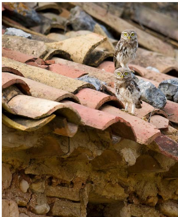
Jeunes chevêches qui viennent de prendre leur envol