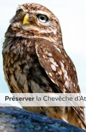
Chevêche d'Athéna