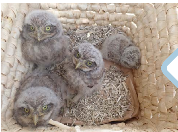
Jeunes chevêches recueillies au Centre régional de sauvegarde de la faune sauvage