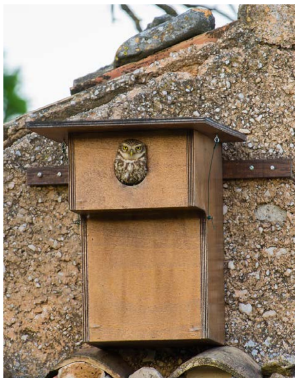
Nichoir occupé par la chevêche

La chevêche est un indicateur de biodiversité et un auxiliaire de culture. Sa présence dans nos campagnes est liée au maintien d'éléments paysagers tels que les haies, les zones enherbées, les cabanons agricoles et les vieux arbres, les murets de pierres sèches qui garantissent à la fois sources d'alimentation et sites de reproduction.