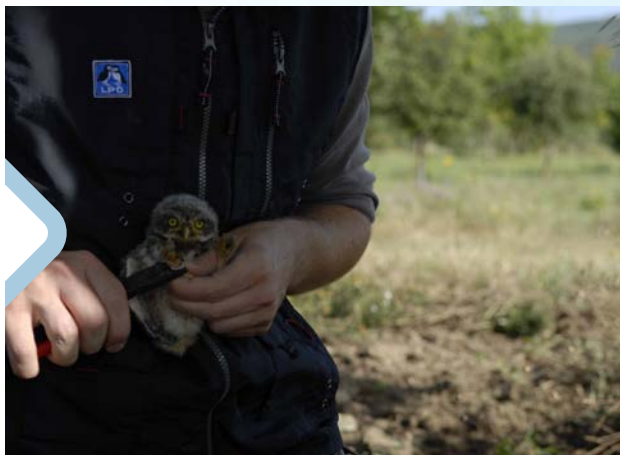
Baguage d'un poussin

Un programme de suivi pluriannuel des paramètres de reproduction et de baguage des oiseaux, mené en partenariat avec le Muséum National d'Histoire Naturelle et l'Institut Méditerranéen de Biodiversité et d'Écologie, permet d'étudier comment différents facteurs – comme les pratiques agricoles ou le changement climatique – influencent cette espèce (productivité, survie des oiseaux...).