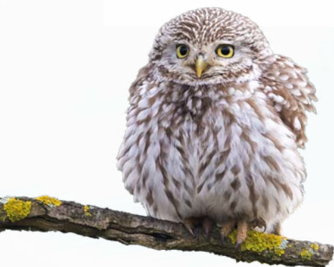
Chevêche d'Athéna

Le programme inclut la rédaction d'articles scientifiques, l'organisation de conférences et la création de supports de communication, l'animation de la «Nuit de la chouette», la coordination de chantiers participatifs pour la construction de nichoirs, la formation aux protocoles de suivi des mâles chanteurs et des nichoirs, ainsi que la gestion d'enquêtes de sciences participatives.