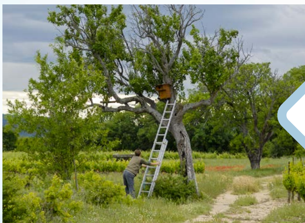
Pose de nichoir