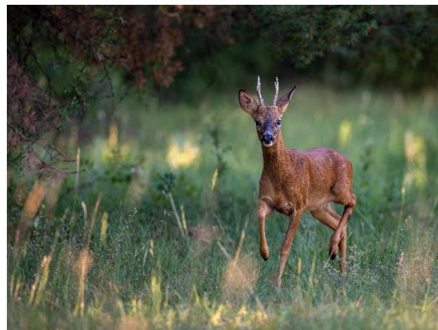
Chevreuril européen

campagne 2023/2024, le plan de chasse départemental au grand gibier a augmenté l'attribution maximale à 832 individus 9 .