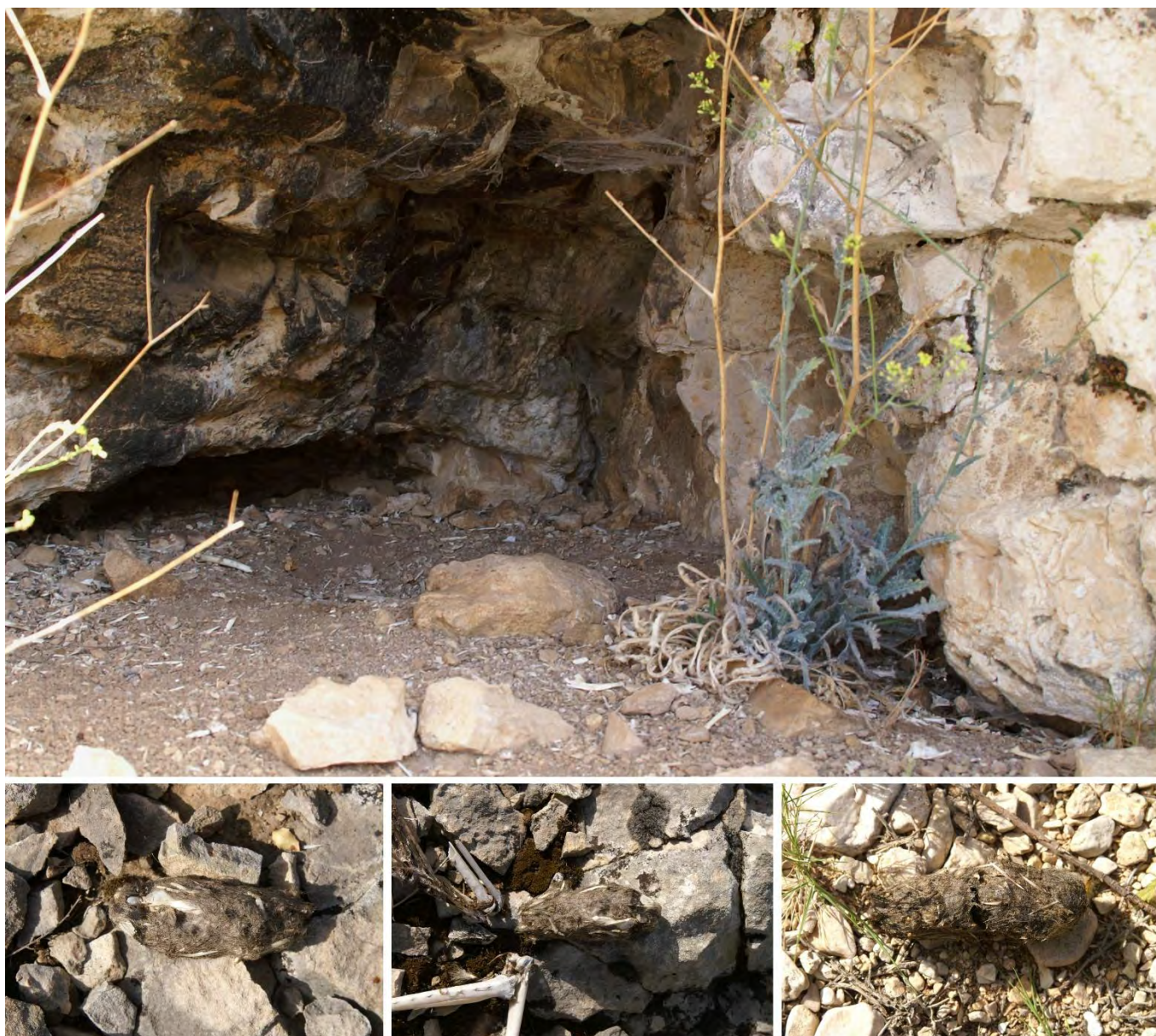
Nid de Grand-duc d'Europe dans le massif de l'Étoile (en haut) et pelotes de réjection autour du nid (en bas)

roux et le Loup gris. Les deux premiers sont stigmatisés par les milieux cynégétiques et les pouvoirs publics, et font l'objet de prélèvements cynégétiques importants sur l'Étoile-Garlaban. Or, cette « gestion » par élimination paraît peu conforme avec le classement en site Natura 2000 de ce territoire, qui a pour objectif de maintenir la biodiversité des milieux, dans une logique de développement durable à travers la conservation d'aires protégées. Quant au loup, son installation sur l'Étoile-Garlaban risque de susciter des réactions diverses et antagonistes des différents usagers du territoire.