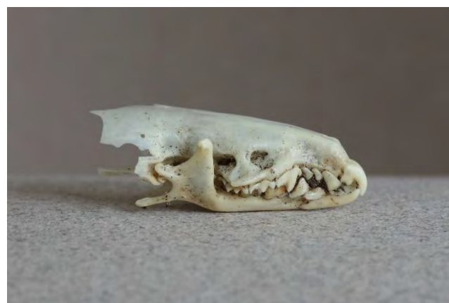
Crâne de Crocidure musette extrait d'une pelote de réjection d'Effraie des clochers

La Crocidure musette est présente dans toute la région à l'exception des zones de haute montagne. Elle est particulièrement abondante en zone méditerranéenne (Poitevin & Quéré, op. cit. ). Elle fréquente les milieux herbacés plutôt secs, les friches et les jardins des zones périurbaines. On la trouve aussi dans les garrigues et les anciennes cultures en terrasse. Elle est présente et commune sur l'ensemble de l'Étoile-Garlaban.