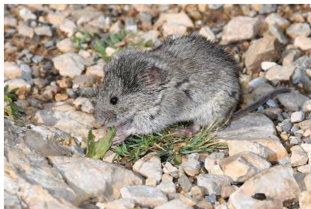
Campagnol des neiges

notamment dans le nord et l'est des Bouches-du-Rhône (Poitevin & Quéré, op. cit. ).