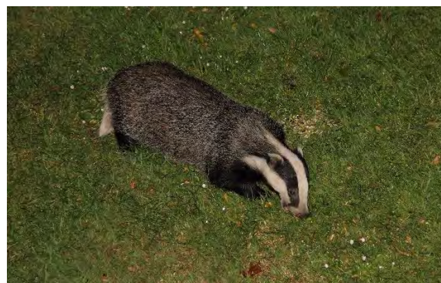
Blaireau européen

En France, le Blaireau européen ne figure plus dans la liste des ESOD, mais il est toujours considéré comme gibier et sa chasse est donc autorisée.