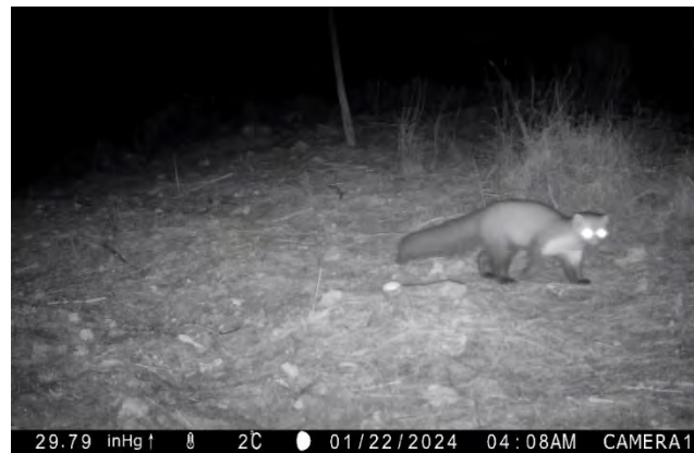
Fouine au piège-photo

La Fouine est un mustélide de taille moyenne, solitaire et plutôt nocturne. Elle est largement répartie en France mais, dans le Midi, sa présence en milieu urbain est plus rare que dans le reste du pays (Poitevin et al. , op. cit. ).