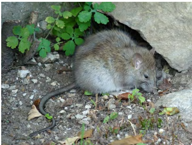
Rat noir

Le Rat noir est classé par l'UICN parmi les 100 espèces les plus envahissantes au monde (Lowe et al. , 2000). En zone méditerranéenne, il est très commun. Contrairement au Rat surmulot, il peut s'affranchir totalement de la présence d'eau et fréquente tous les espaces naturels, en particulier les pinèdes et les chênaies. Il ne néglige pas pour autant les milieux anthropisés, y compris les zones urbaines. Il est connu pour être bon grimpeur et s'observe fréquemment dans les arbres où il construit le plus souvent son nid. On le trouve également dans les combles des maisons où sa présence est moins désirable.