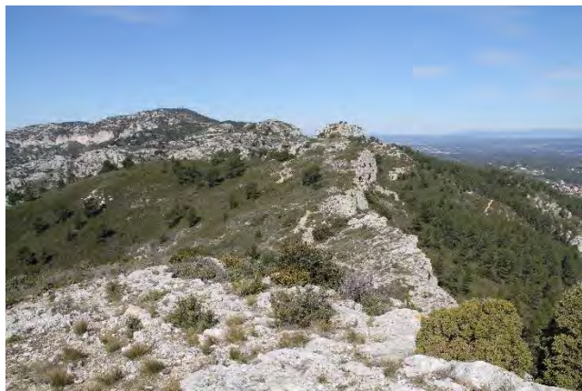
Les crêtes du massif de l'Étoile

analysé l'ensemble de la littérature disponible, les atlas des mammifères en particulier, et fait quelques recherches ciblées sur Internet. Nous avons intégré le résultat des analyses de pelotes de réjection de rapaces collectées sur la zone d'étude. Celles-ci ont toutes été réalisées par Patrick Bayle.