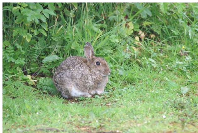
Lapin de garenne

Le Lapin de garenne est une espèce chassable. Il est pourtant aujourd'hui classé parmi les espèces « quasi menacées » dans les listes rouges des mammifères continentaux de France et d'Europe. Au niveau mondial, l'UICN le considère en danger dans son aire de distribution originelle, soit la péninsule ibérique et le Midi de la France.