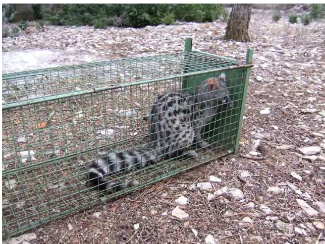
Genette commune capturée accidentellement dans une « boîte à fauve »

L'utilisation des pièges n'est pas sans conséquence sur le reste de la faune et les dégâts collatéraux existent. Sont-ils nombreux ? Difficile de répondre à cette question. Par contre, comme le prouve l'exemple de la louve retrouvée morte dans le Gard, la menace est réelle pour le loup. Elle l'est tout autant pour d'autres animaux, le chien en particulier. Sur l'Étoile-Garlaban, le piégeage des ESOD reste encore pratiqué au sein du périmètre Natura 2000 à grande échelle. Ce n'est pas le cas partout. Dans le Parc national des Calanques, la « régulation par piégeage » ne peut être autorisée qu'en derniers recours : « à titre exceptionnel, en cas d'échec des mesures alternatives ... » 39 .