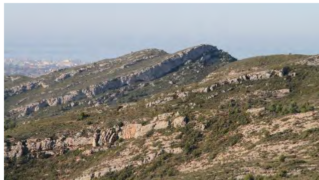
Vue du massif du Garlaban

de mammifères terrestres ayant été observées dans les massifs de l'Étoile et du Garlaban, afin de permettre une meilleure prise en compte des enjeux naturalistes dans le périmètre du site Natura 2000, en lien, conformément aux objectifs du réseau auquel il appartient, avec la préservation des habitats.