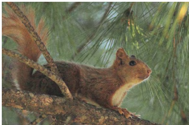
Écureuil roux

L'Écureuil roux est bien réparti sur l'Étoile-Garlaban. Il est présent partout où il y a des arbres en quantité suffisante. La base de données Faune-PACA contient près de 350 observations d'écureuil, celles-ci étant bien réparties sur l'ensemble du site.