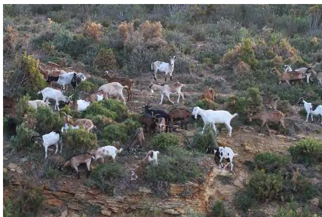
Troupeau de Chèvre domestique férale dans la colline

Quelques troupeaux de Chèvre domestique vagabondent librement sur l'Étoile-Garlaban. L'origine de ces chèvres n'est pas connue avec certitude, mais il est probable qu'elles se soient échappées d'un élevage ou qu'elles aient été relâchées dans la nature par des personnes souhaitant s'en débarrasser.