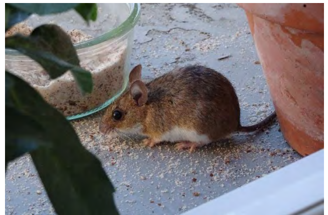
Mulot sylvestre

En région PACA, le Mulot sylvestre est le mulot le plus commun. Il vit dans tous les biotopes boisés ou pourvus de végétation herbacée. Son régime alimentaire est essentiellement granivore, mais il consomme aussi des baies et des invertébrés. C'est un grand amateur de glands, que ce soit ceux de Chêne pubescent ( Quercus pubescens ), vert ou kermès ( Q. coccifera , Poitevin & Quéré, op. cit. ).