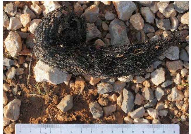
Fèces de Loup gris

Dans les massifs provençaux, la venue du loup a été confirmée dans la Sainte-Baume en 2008-2009 28 et dans la Sainte-Victoire en 2012 (Cheylan & Roda, 2024). Quant aux Calanques, l'implantation de l'espèce est encore plus récente. Les premiers indices du retour du loup y sont enregistrés à la fin de l'année 2020. Sa présence est ensuite notée par les agents du Parc national le 14 février 2021. Un couple s'installe dès 2022, avec la reproduction avérée en 2022, 2023 et 2024, et la constitution d'une meute (N. Rossignol, comm. pers.). Dans ce contexte d'expansion de l'espèce, et compte tenu de sa présence avérée dans les massifs proches, on peut logiquement penser que le loup puisse s'installer durablement sur l'Étoile-Garlaban.