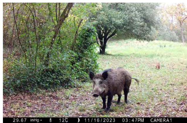
Sanglier femelle et son marcassin au piège-photo

Le Sanglier est une espèce commune en France, considérée comme une espèce gibier dont la chasse est autorisée.