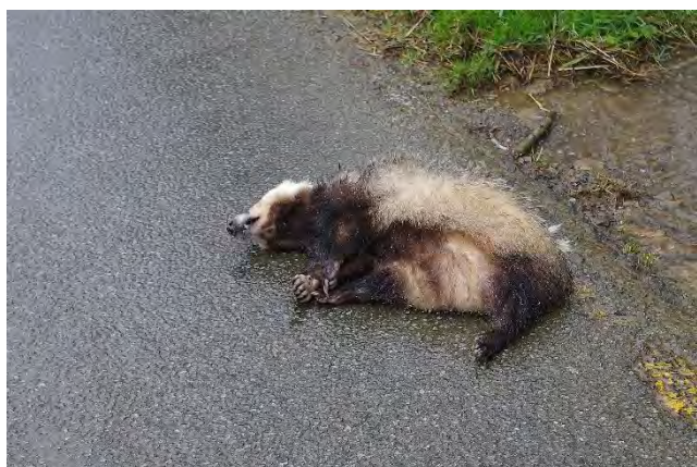
Blaireau européen victime d'une collision routière

Le blaireau est largement distribué dans la région. Il y fréquente des milieux boisés et ouverts (prairies, plaines viticoles...) si le sol est suffisamment meuble pour lui permettre de creuser son terrier. Bien que l'espèce soit peu étudiée en PACA, il semble que les densités soient très variables, et même assez faibles dans beaucoup de milieux provençaux (Rigaux, 2016b in LPO et al. , 2016).