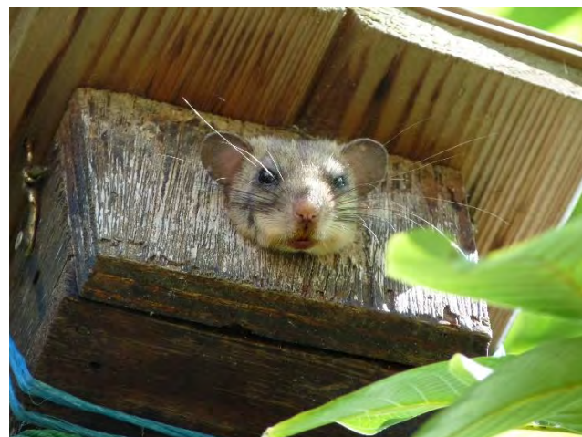
Loir gris

arbres, les fissures rocheuses et les grottes, les nichoirs et même les combles des maisons.