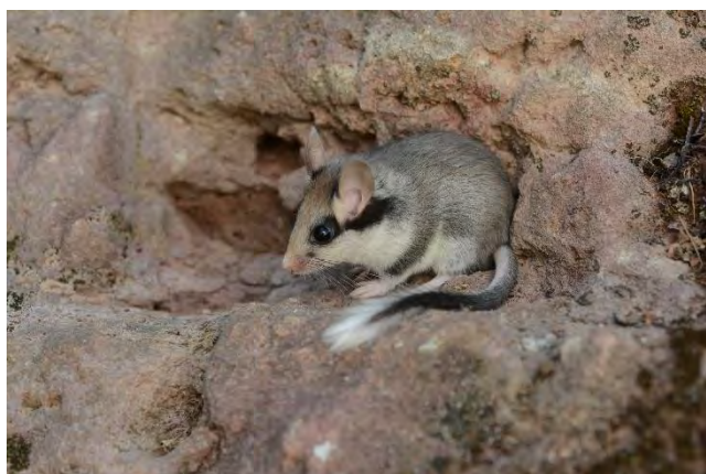
Lérot © Jean-Michel Bompar

Dans la région PACA, l'espèce est largement distribuée bien que, dans de nombreux secteurs, les données manquent. Ce gliridé, au caractère ubiquiste, occupe des milieux variés et affectionne les substrats rocheux ou pierreux. On le trouve aussi bien dans des habitats naturels, par exemple dans les Calanques de Marseille, qu'anthropisés. Le Rat noir ( Rattus rattus ) entre souvent en compétition avec le Lérot, au détriment de celui-ci (Poitevin & Quéré, 2021).