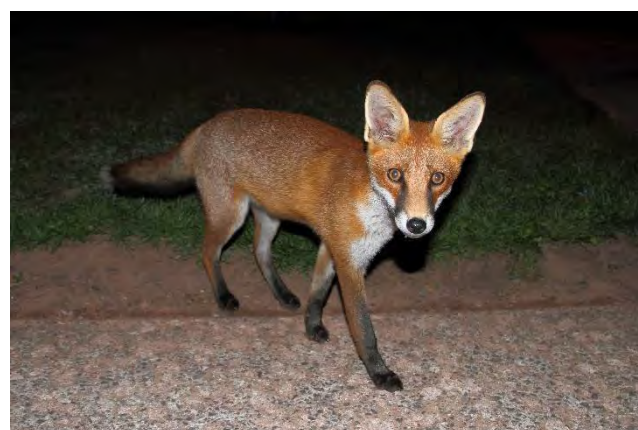
Renard roux

Le renard a une activité crépusculaire à nocturne, mais il n'est pas rare de l'observer en journée. Dans la région PACA, le renard occupe tous les milieux, du bord de mer aux reliefs montagneux des Alpes. C'est l'un des mammifères terrestres les plus répandus.