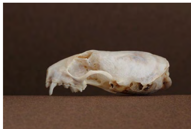
Crâne de Belette d'Europe extrait d'une pelote de réjection de Grand-duc d'Europe

La Belette d'Europe fait partie de la liste des espèces de gibier et on peut donc la chasser en France. Elle peut également faire partie des ESOD, mais seuls quelques rares départements l'inscrivent encore 23 , ce qui n'est plus le cas dans les Bouches-du-Rhône.