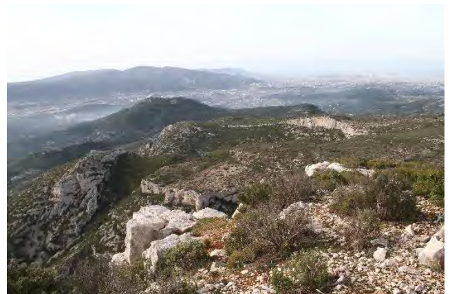
Vue depuis le sommet du Garlaban

Ce panorama contrasté ne doit pas faire oublier l'incidence positive du loup sur les milieux naturels. D'un point de vue écologique, la venue du loup est une chance. Il régule naturellement les populations d'ongulés dont il se nourrit majoritairement. Mais l'effet de ce grand prédateur est bien plus large encore. Les charognards, comme le Grand Corbeau ( Corvus corax ), profitent des proies tuées par le loup. On cite souvent l'effet positif de la réintroduction du loup dans le Parc national américain de Yellowstone, et la succession d'effets bénéfiques sur la faune et la flore. C'est probablement vrai, même si la théorie de la cascade trophique souvent évoquée, est remise en cause par certains chercheurs qui lui reproche son aspect simpliste 40 .