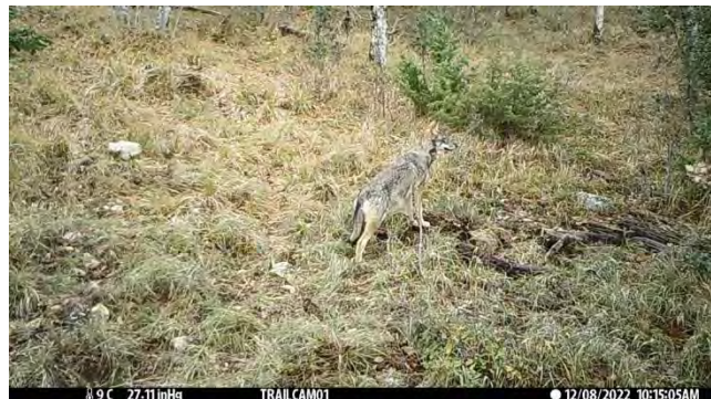
Loup gris au piège-photo

Il y a une trentaine d'années, le loup fit son retour en France. Au regard de la capacité de l'espèce à conquérir de nouveaux milieux, cela reste un phénomène relativement récent. Le loup est toujours dans une phase colonisatrice, et l'hypothèse de l'installation pérenne d'une meute sur l'Étoile-Garlaban reste une option envisageable. Néanmoins, la cohabitation avec l'Homme n'est pas toujours simple, et sa venue occasionne souvent des réactions hostiles de la part des différents usagers des milieux naturels et agricoles (éleveurs, agriculteurs, chasseurs, promeneurs...). La presse ne se prive pas d'en faire écho, notamment lors d'attaques sur les troupeaux 35 . Culturellement, l'acceptation par la population de cet animal mythique n'est pas évidente. Le loup fascine autant qu'il fait peur, et les réactions face à cet animal peuvent être vives. D'autre part, la pression qu'il exerce sur les populations d'ongulés peut le mettre en concurrence avec les chasseurs, qui ne sont pas toujours prêts à