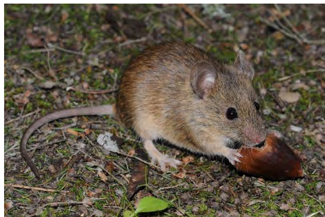
Souris à queue courte

Une autre espèce, cousine de la précédente, est la Souris à queue courte. En France, cette souris est présente en Languedoc-Roussillon et dans une grande moitié sud-ouest de la Provence. Son origine lointaine est le Maghreb, mais elle est établie dans le sud de la France depuis l'époque romaine. Contrairement à la Souris domestique, commensale de l'homme, on la trouve en zone naturelle dans des milieux xériques tels que les garrigues. Elle apprécie également les zones herbacées et les cultures traditionnelles (Poitevin & Quéré, op. cit. ).