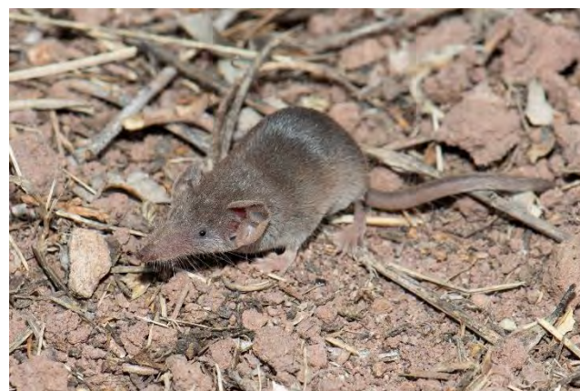
Pachyure étrusque

Avec une taille (tête + corps) de 35 à 54 millimètres et un poids de deux grammes, la particularité de la Pachyure étrusque est d'être le plus petit mammifère de France, et même l'un des plus petits dans le monde.