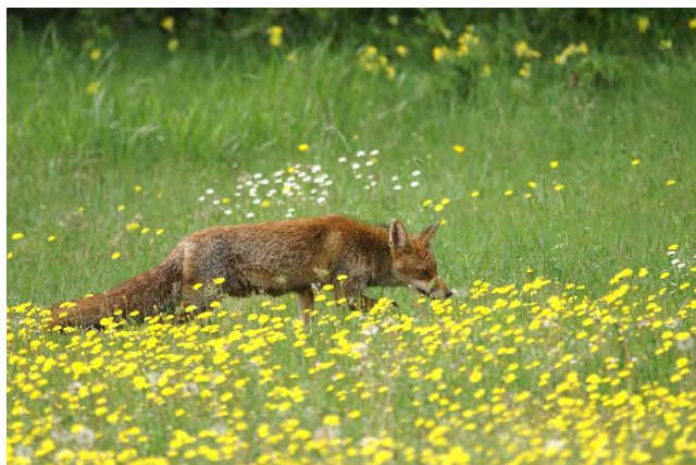
Renard roux

faut-il que le piégeur respecte la réglementation (visite quotidienne du piège dans les toutes premières heures du jour, etc.).