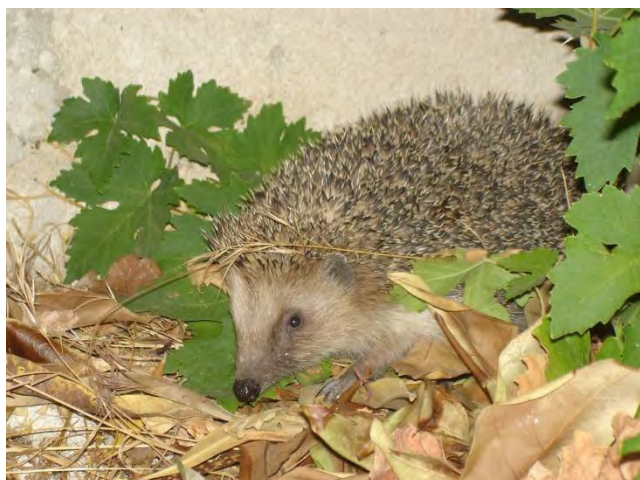
Hérisson d'Europe

Le Hérisson d'Europe fait partie du petit nombre d'espèces de mammifères protégées en France. Il n'est pas menacé dans notre pays, ni dans son aire de répartition mondiale.