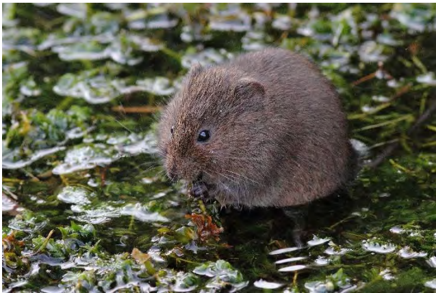
Campagnol amphibie

décennies, et il est désormais classé dans la catégorie « Vulnérable » (VU) dans la Liste Rouge mondiale de l'UICN (Rigaux et al. , 2008) et protégé depuis 2012 12 à l'échelle nationale.