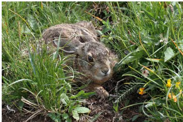
Lievre d'Europe

& Mondain-Monval in Poitevin et al. , op. cit. ). L'espèce occupe une grande variété d'habitats, mais elle affectionne surtout les formations herbeuses avec haies et buissons. Dans la région, on la trouve volontiers dans les vignobles.