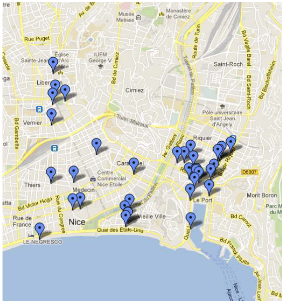
Figure 2. Répartition des sites de nidification du Martinet pâle à Nice. Chaque marque correspond à un site probable de nidification (voir la section Matériels et Méthodes pour la signification exacte du terme). Carte générée à l'aide du logiciel « Google Maps ».

La Figure 2 montre la répartition spatiale des sites probables de nidification observés dans cette étude. Tous les sites sont confinés à un espace assez restreint. De grandes parties de la ville ne sont pas occupées ; ce sont principalement les quartiers les plus récents qui offrent peu de sites de nidification. Mais tous les quartiers anciens de Nice n'abritent pas forcément des Martinets. Par exemple dans le vieux Nice, seuls les alentours du Palais de justice semble fréquentés.