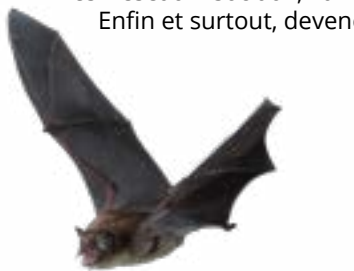
Myotis daubentoni

Donnez de l'ampleur à vos convictions , vos idées, ou vos témoignages. Soyez actif sur les réseaux sociaux, lanceur d'alertes... Enfin et surtout, devenez bénévole !