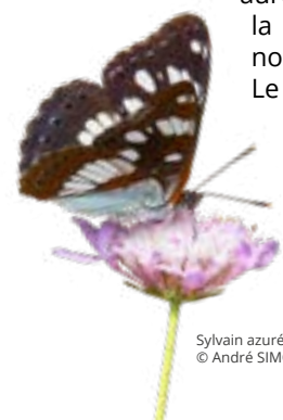
Sylvain azuré

Lors de nos sorties nature vous aurez l'occasion d'observer la richesse faunistique de notre région. Le site faune-paca.org vous permettra de saisir vos observations et de participer ainsi à la protection des espèces et plus largement de la biodiversité.