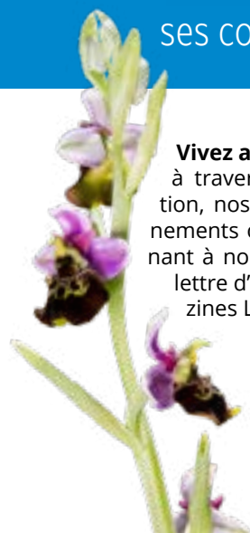
Ophrys bourdon

Vivez au plus près de la nature à travers notre offre de formation, nos sorties nature, nos événements ou encore en vous abonnant à nos supports comme notre lettre d'information et nos magazines LPO.