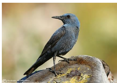
Monticole bleu