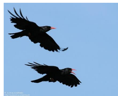
Crave à bec rouge

Les oiseaux en sont les représentants les plus prestigieux aux yeux de tous les amateurs de nature. L'espoir d'observer l'Aigle Royal ou le Tétraz Lyre dans la partie montagnarde, la Fauvette pitchou ou le Monticole bleu dans la partie méridionale, attire de nombreux visiteurs.