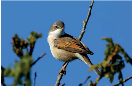
Fauvette grisette

Le plateau de Puimichel possède encore quelques milieux naturels favorables à l'observation de diverses espèces d'oiseaux. Le regard se pose alors sur les buissons, arbustes et arbres, à la recherche des mélodieux mais discrets habitants, qui parfois s'élancent dans le ciel.