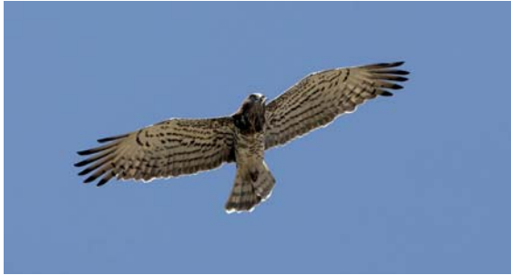
Circaète Jean-le-Blanc

Espèces emblématiques pouvant être rencontrées : Pie-grièche méridionale, Pie-grièche écorcheur, Alouette des champs, Alouette lulu, Bruant ortolan, Bruant proyer, Bruant zizi, Pipit rousseline, Perdrix rouge, Tarier pâtre, Fauvette passerinette, Fauvette grisette, Linotte mélodieuse, Circaète Jean-le-Blanc, Milan noir, Busard cendré, Bondrée apivore. Attention, voir ces espèces n'est pas garanti ! Vous pourrez néanmoins profiter de beaux paysages et vous aurez la possibilité d'apercevoir d'autres espèces (papillons, lézards, mammifères, etc.).