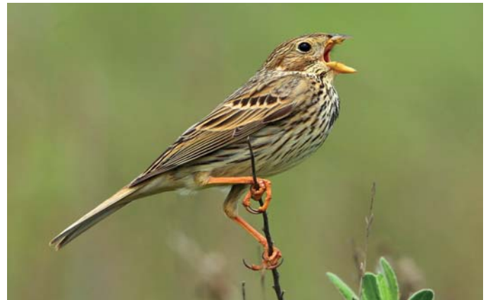
Bruant proyer