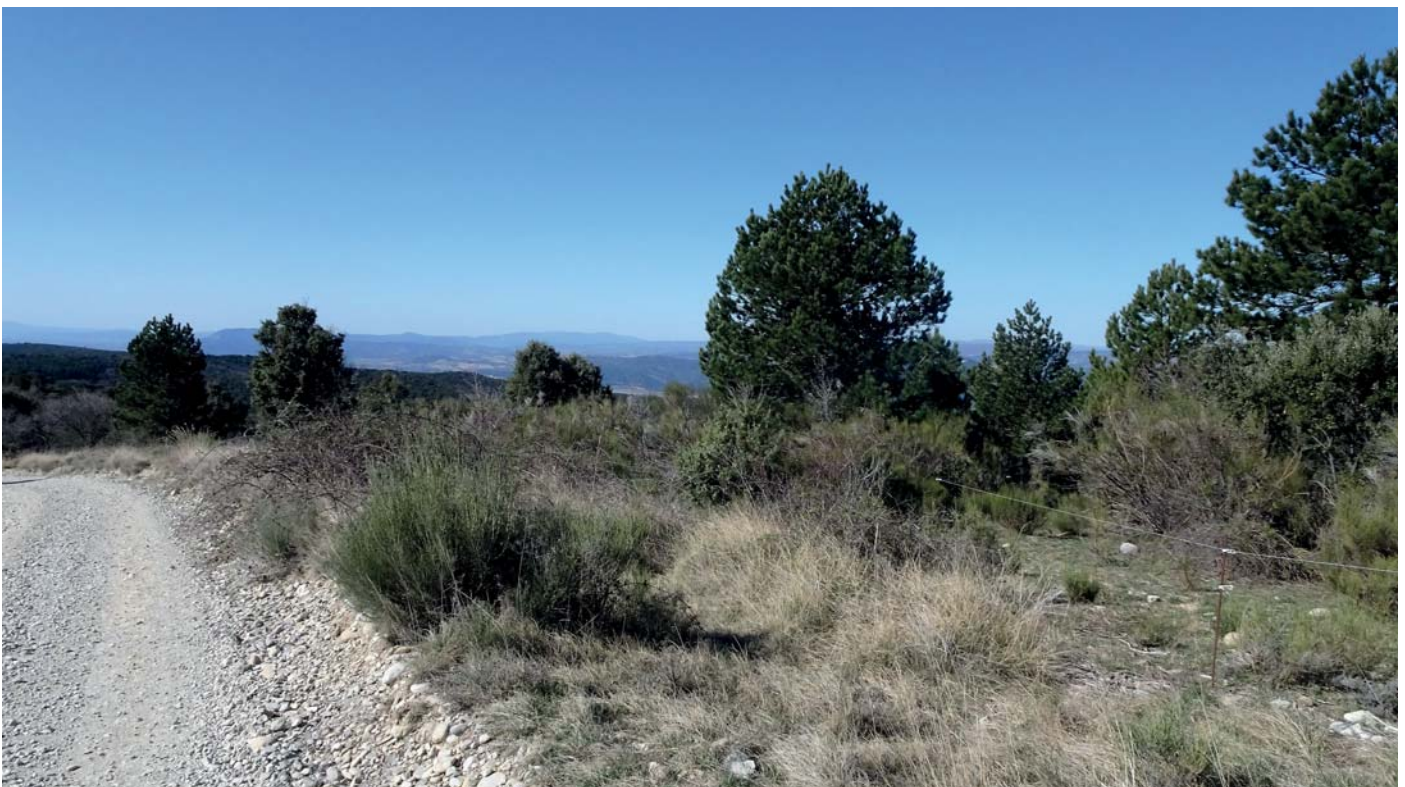
Sentier entre les panneaux photovoltaïques du plateau de Puimichel