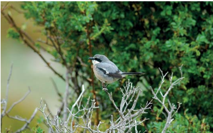
Pie-grièche méridionale