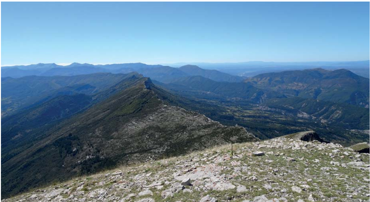
Vue depuis le sommet du Couar