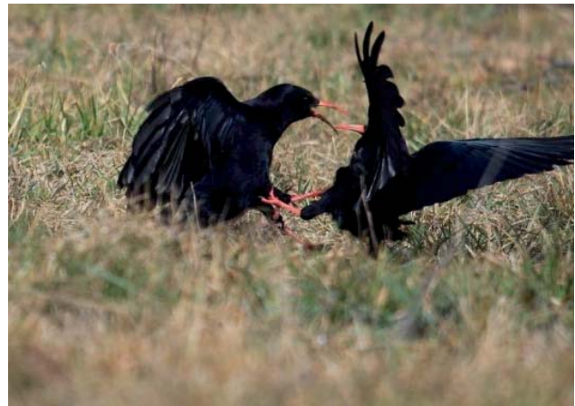
Craves à bec rouge