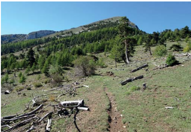
Vue sur le Pic de Couar, zone de combat