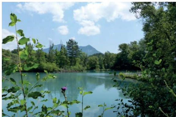
Lac de Gaubert

Le Lac de Gaubert, plan d'eau entouré de bois et de champs, est l'endroit idéal pour une balade découverte en famille. La balade du tour du lac vous permettra d'observer diverses espèces d'oiseaux, notamment des oiseaux au plumage coloré : le Guépier d'Europe et le Martin-pêcheur d'Europe.