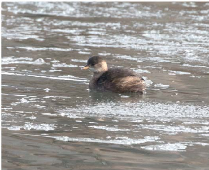
Grèbe castagneux © Michel Davin