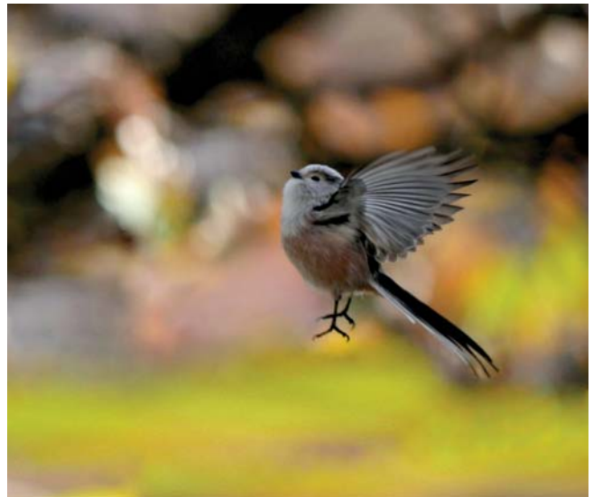
Mésange à longue queue