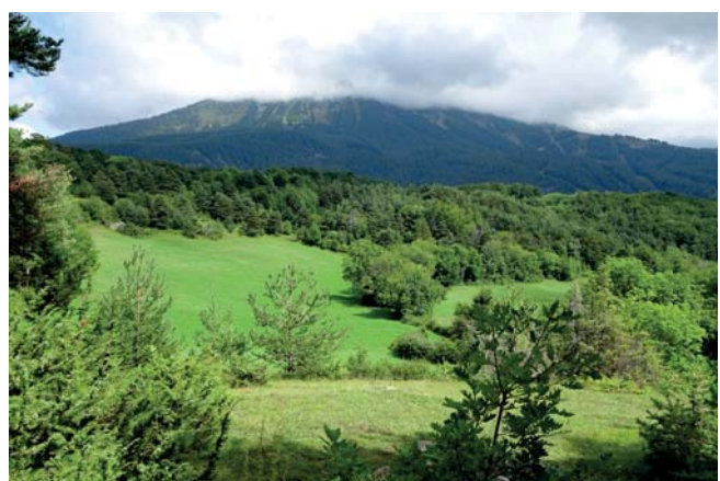
Haies et clairières à scruter