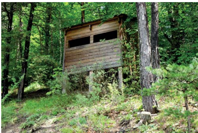
Observatoire donnant vue sur le lac