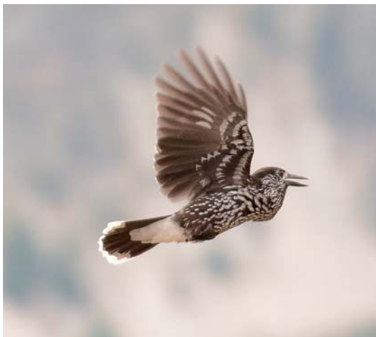
Cassenoix moucheté