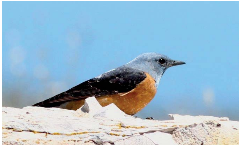
Monticole de roche