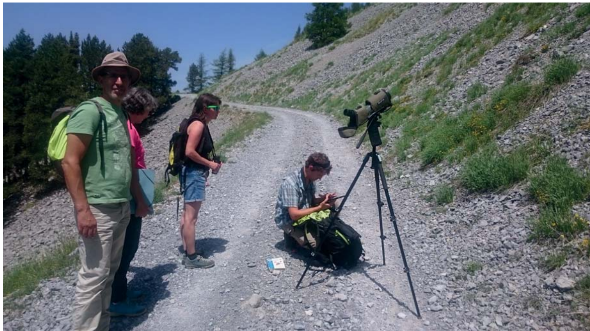
Piste menant au plateau de la Chau