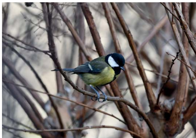
Mésange charbonnière