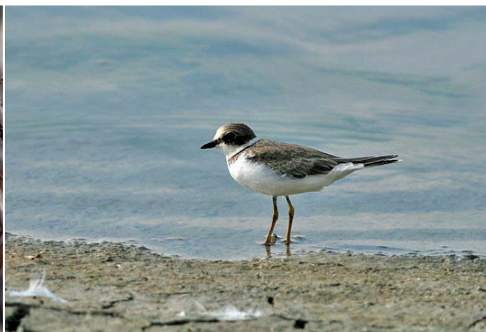
Petit gravelot