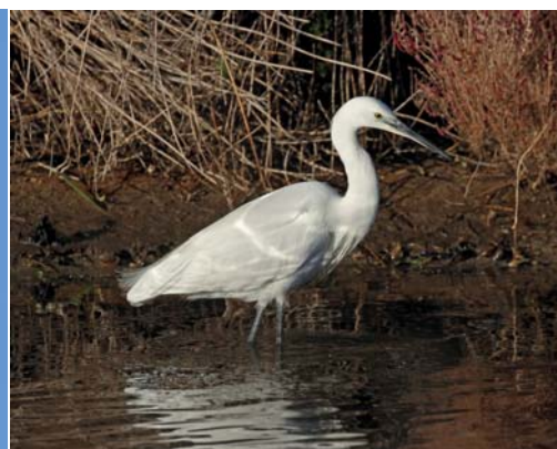
Aigrette garzette