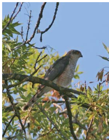
Epervier d'Europe

Arrêtez-vous au niveau du surplomb qui domine la Durance et scrutez les berges d'en face. Les grands cormorans se sèchent au soleil tandis que la Grande aigrette , l' Aigrette garzette ou le Héron cendré ont généralement leurs longues pattes plongées dans l'eau. La Bergeronnette des ruisseaux mais aussi le Petit et le Grand gravelot se déplacent sur les graviers à la recherche de petits insectes aquatiques.