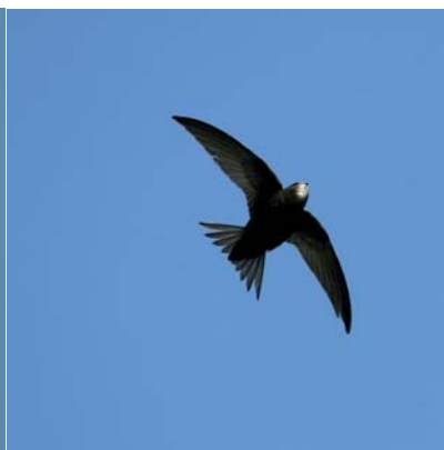
Martinet noir