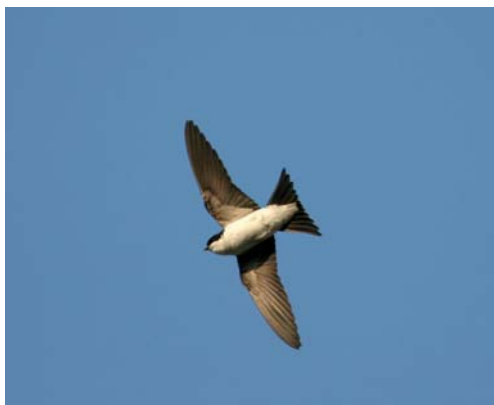
Hirondelle de fenêtre