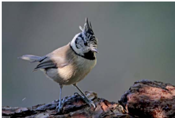
Mésange huppée