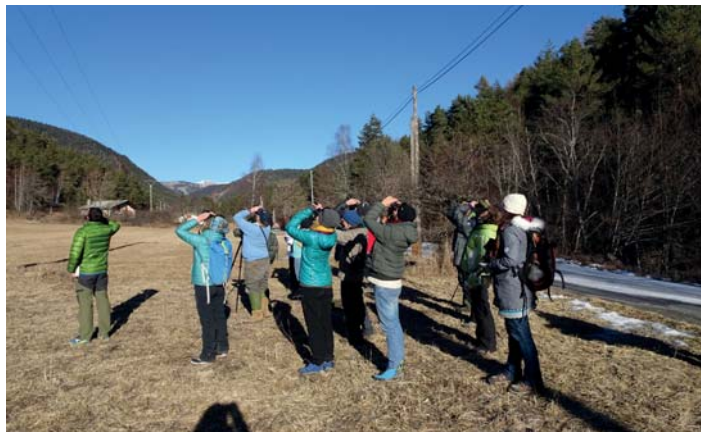
Observation près de Verdaches