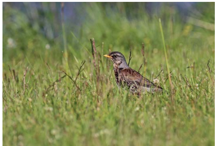
Grive litorne