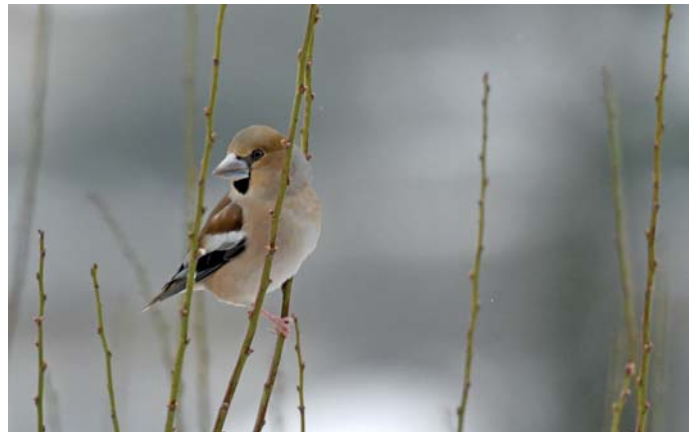
Grosbec casse-noyaux

En hiver ou à l'automne, les bandes de grives et de passereaux, ainsi que les espèces de montagne qui viennent occuper des zones plus basses, justifient une visite.