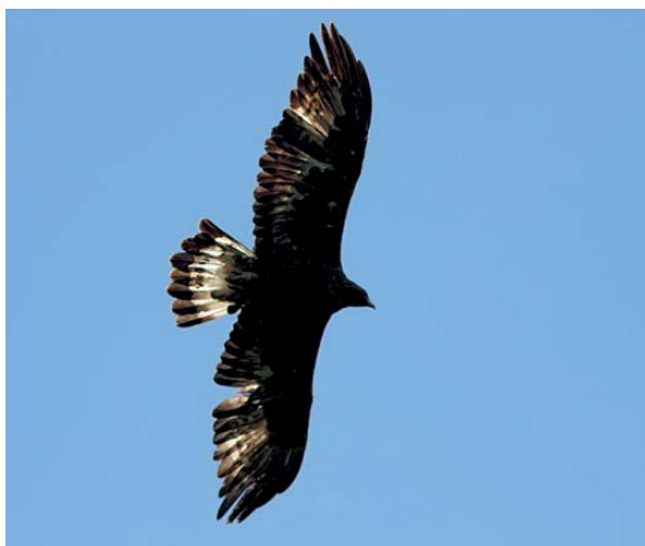
Aigle royal

Seyne/Chabanon/Grand-Puy/Tête de l'Estrop - 3439ET