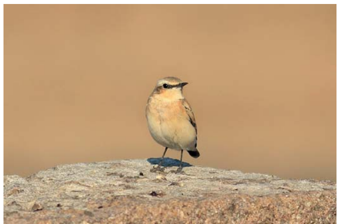
Traquet motteux