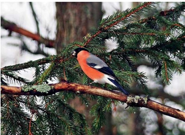
Bouvreuil pivoine