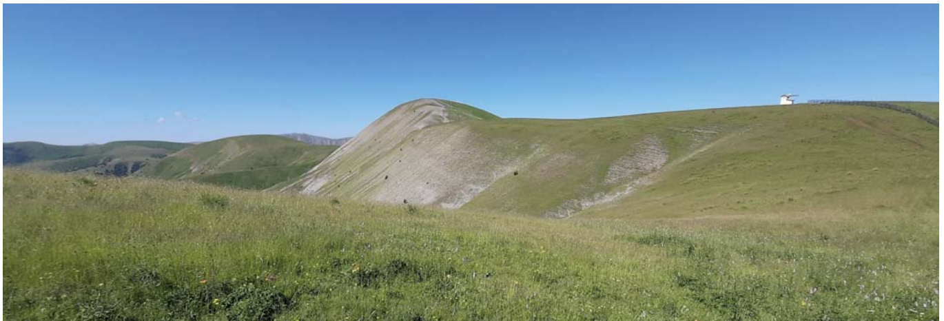
Sommet de tête grosse