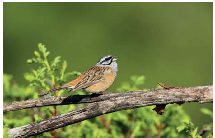
Bruant fou