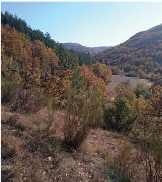
Landes à genêt