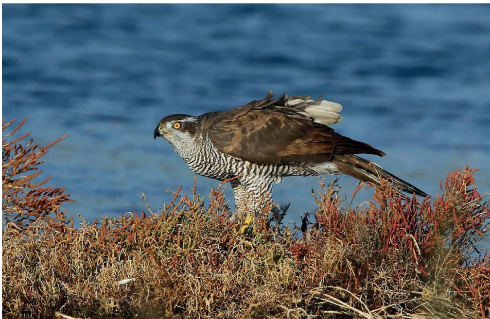
Autour des palombes