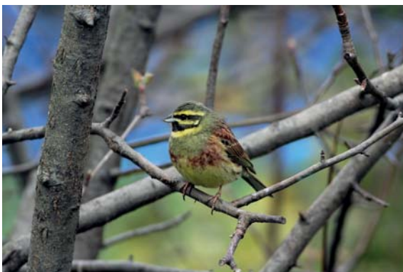
Bruant zizi