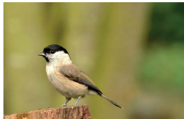
Mésange nonnette