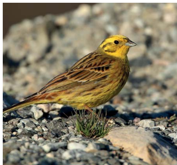
Bruant jaune