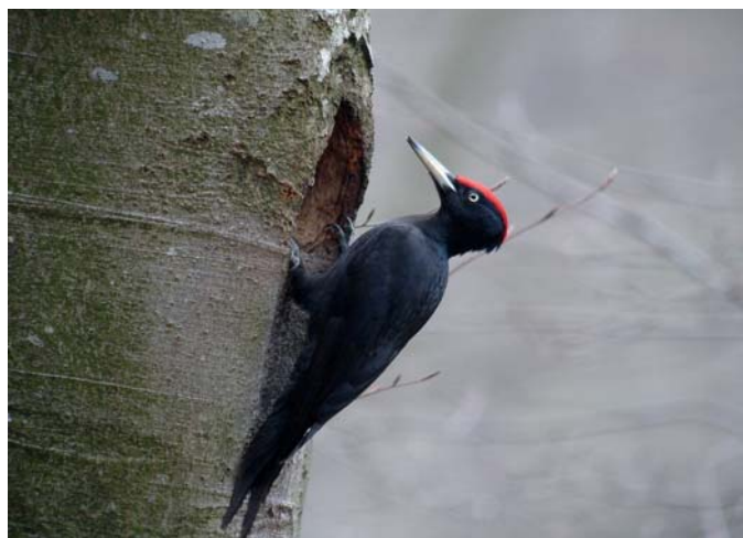
Pic noir