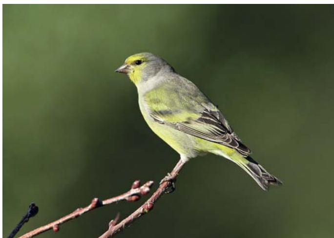
Venturon montagnard