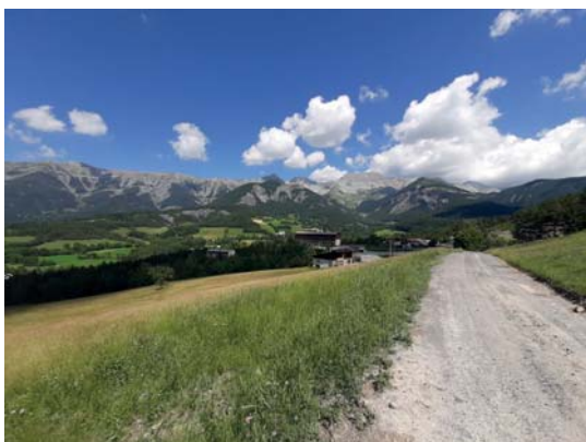
Point d'observation