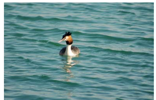
Grèbe huppé