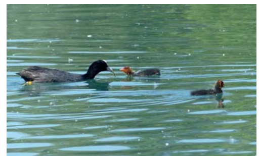
Foulque macroule et ses petits