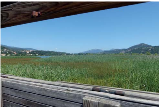
Vue depuis la palissade d'observation ornithologique

Le lac de l'Escale est un lieu d'hivernage prisé par de nombreux canards plongeurs et canards de surface tels que les sarcelles d'hiver qui peuvent être observées par groupes de plusieurs centaines d'individus entre octobre et mars. D'autres espèces, telles que le Foulque macroule et le Fuligule milouin , peuvent aussi être observés en grand nombre dans ce type de milieu. De grands échassiers tels que le Héron cendré , la Grande Aigrette ou l' Aigrette garzette sont aussi souvent présents sur ce site, tout comme de nombreux grands cormorans . Guettez la Bécassine des marais et les petits limicoles en halte migratoire au printemps et à l'automne.