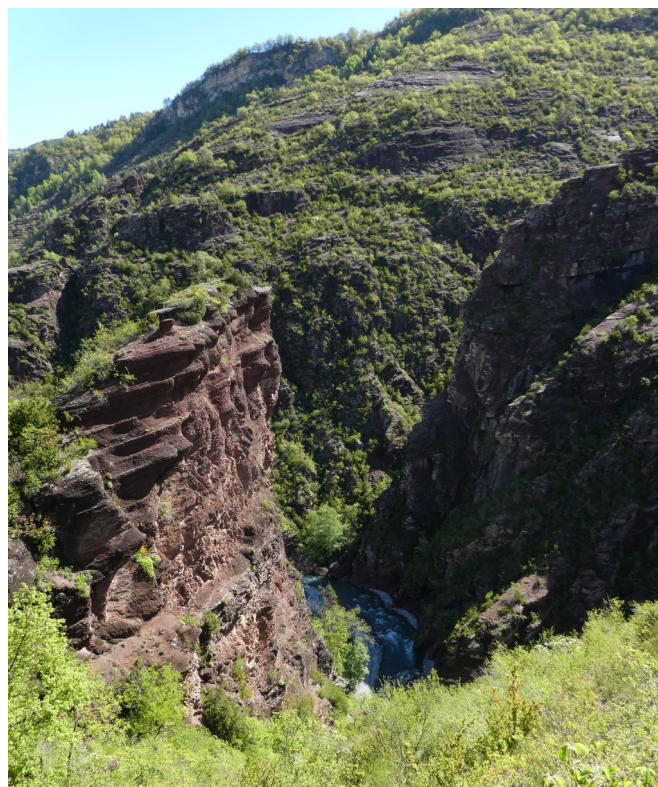
Gorges de Daluis