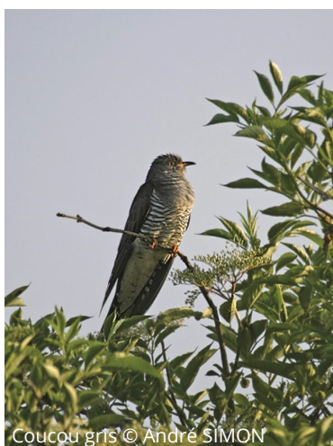
Coucou gris © André SIMON