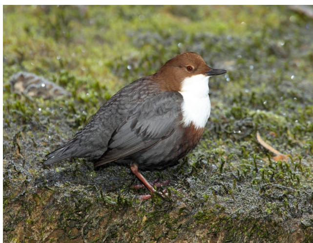
Cincle plongeur © Aurélien AUDEVARD