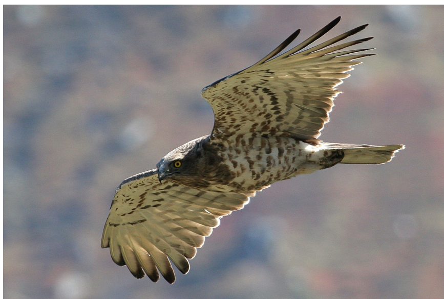
Circaète Jean-le-Blanc