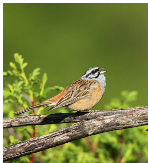
Bruant fou