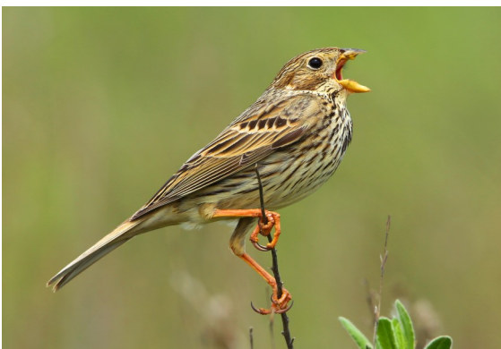
Bruant proyer

Attention, voir ces espèces n'est pas garanti ! Vous pourrez néanmoins profiter de beaux paysages et vous aurez la possibilité d'apercevoir d'autres espèces (papillons, lézards, mammifères, etc.).