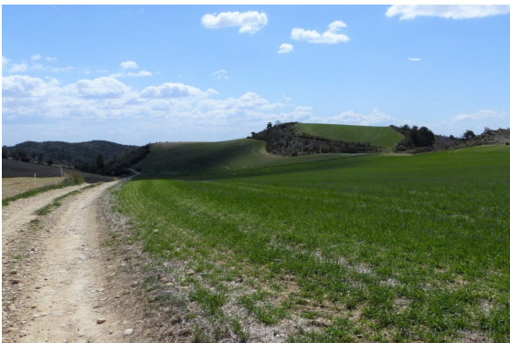
Sentier à travers champs

Barrême / Vallée de l'Asse/Pnr du Verdon (Gps) - 34410T