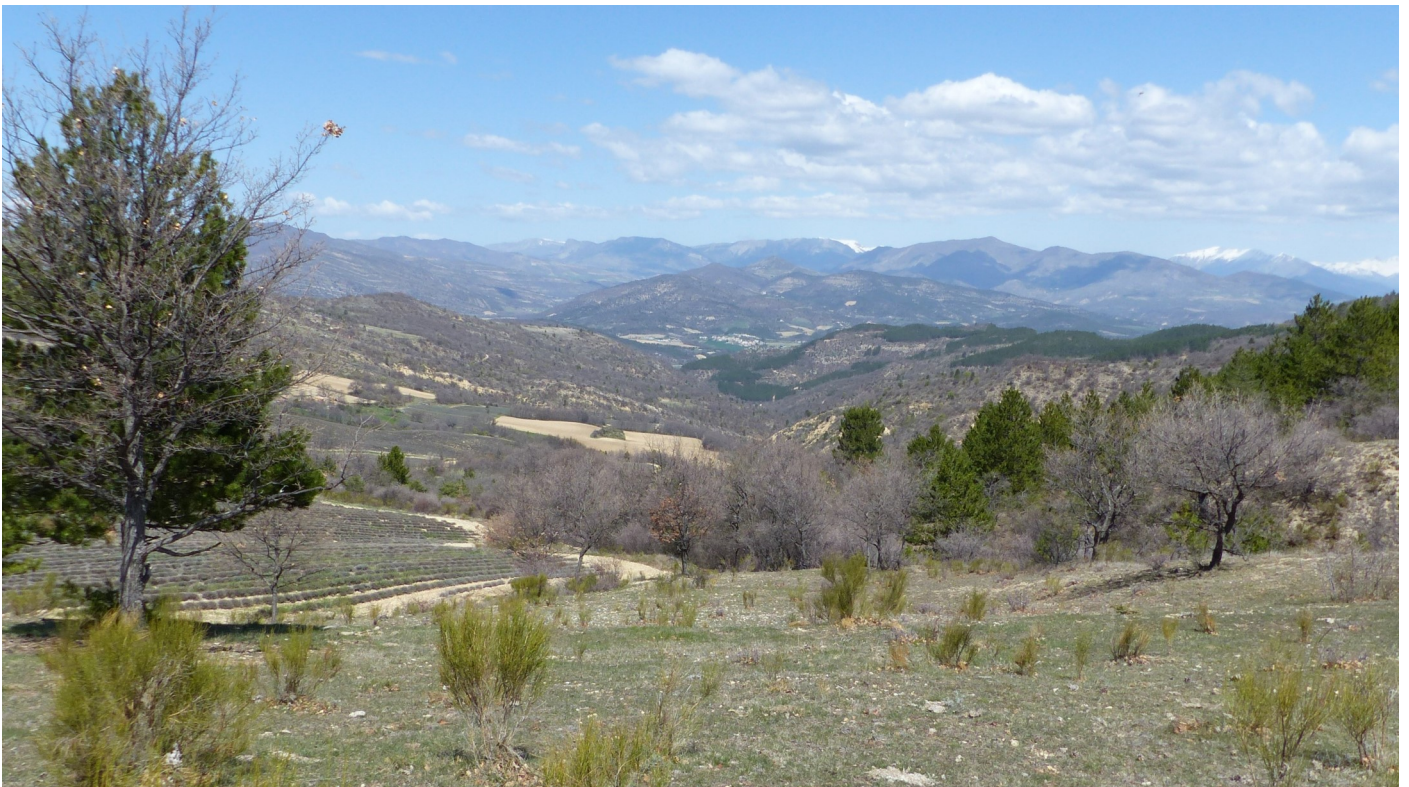
Col de l'Espinouse © Aurélie Nouri