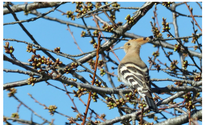
Huppe fasciée