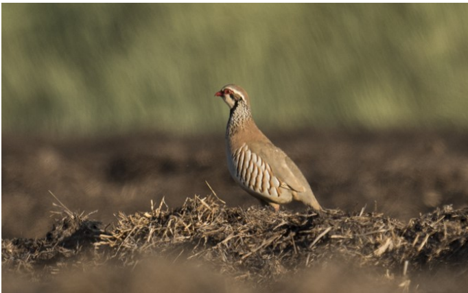
Perdrix rouge