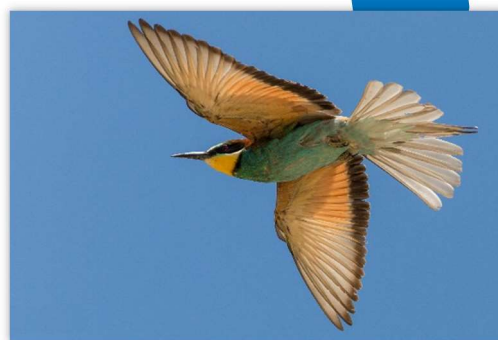
Guêpier d'Europe