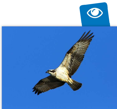
Balbuzard pêcheur

En 2019, le camp de migration ornithologique du Fort de la Revère, c'est 725 personnes sensibilisées , qui sont venues à notre rencontre pour admirer le spectacle de la migration et en apprendre un peu plus sur ce phénomène.