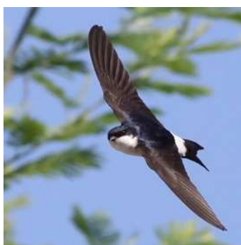
Hirondelle de fenêtre