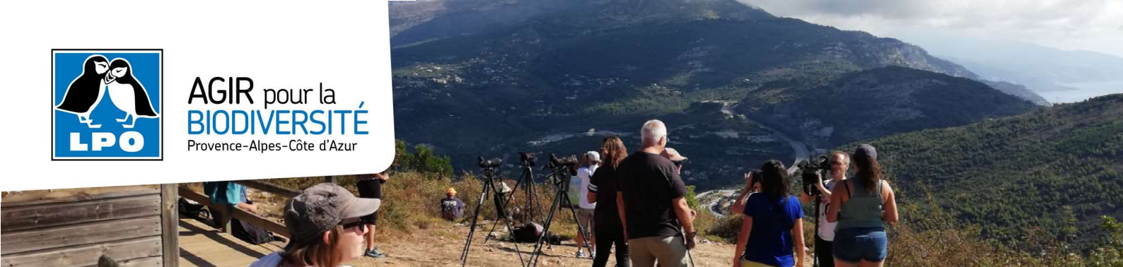
Camp de migration 2019 - PND de la Grande Corniche

AGIR pour la BIODIVERSITÉ Provence-Alpes-Côte d'Azur