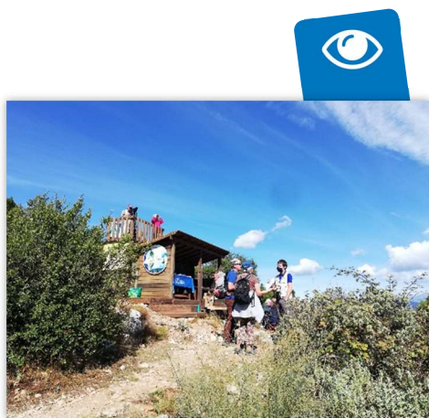
Camp de migration ornithologique

En 2020, le camp de migration ornithologique du Fort de la Revère, c'est 410 personnes sensibilisées , qui sont venues à notre rencontre pour admirer le spectacle de la migration et en apprendre un peu plus sur ce phénomène.