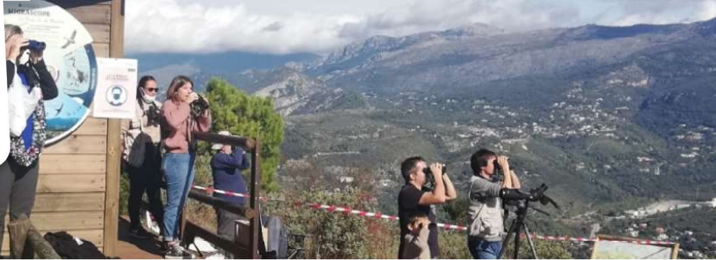
Camp de migration 2020 - PND de la Grande Corniche

AGIR pour la BIODIVERSITÉ Provence-Alpes-Côte d'Azur