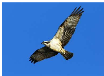
Balbuzard pêcheur