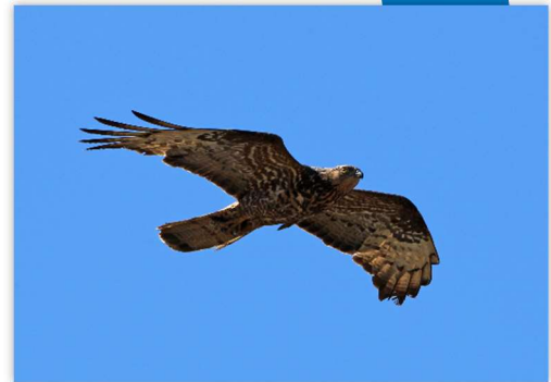
Bondrée apivore