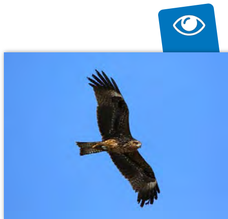
Milan noir

Au total, le suivi 2021 de la migration post-nuptiale aura permis de comptabiliser 31 648 oiseaux migrants depuis le poste d'observation aménagé sur le Parc naturel départemental de la Grande Corniche.