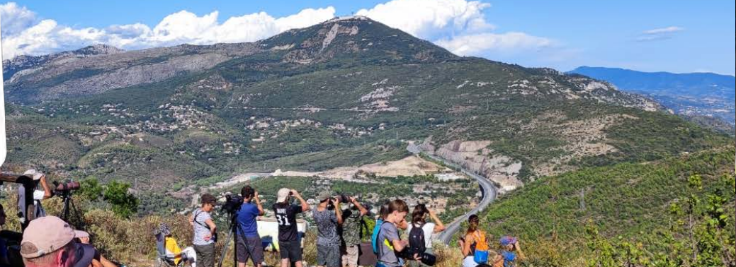
Camp de migration 2021 - PND de la Grande Corniche

AGIR pour la BIODIVERSITÉ Provence-Alpes-Côte d'Azur