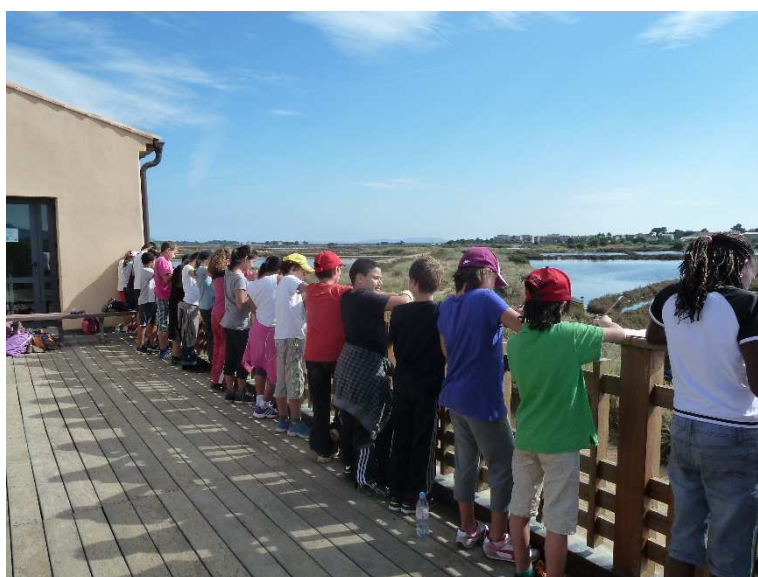
Lecture de paysage depuis la terrasse de l'Espace Nature